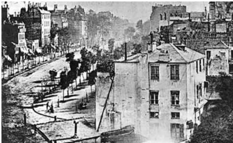
Inglaterra, no começo da revolução industrial.

Tal período apresenta-se rico as descobertas científicas se multiplicam com o objetivo de ampliar a acumulação de capital , com uma burguesia já estabelecida, com poder político e econômico definido e que dominava e aperfeiçoava uma tecnologia que vinha da Idade Média. Segundo