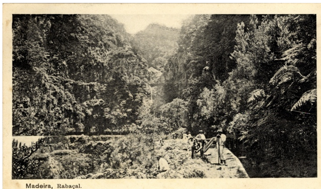
Figura 1. Postal do vale do Rabaçal e levada.

O produto/recurso turístico em apreço são as levadas, que para além de estar associado à paisagem, à cultura material madeirense e aos passeios a pé (pedestrianismo, hiking), é considerado pelo Plano de Ordenamento Turístico Regional (POT) como um produto emergente que urge consolidar e desenvolver de modo a