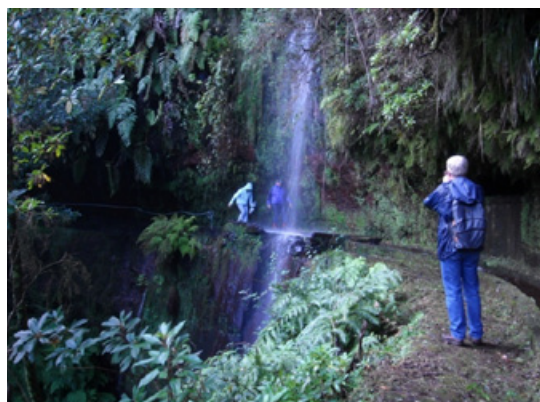
Figuras 2 y 3. caminheiros na Levadas dos Cedros y do Rei durante o MWF 09