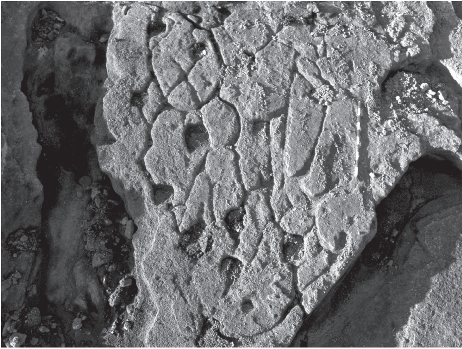
Foto 5. Vista general de un almogarén de Montaña Blanca.

de ellas formas treboladas. Es uno de los paneles más llamativos de cuantos conocemos por la carga simbólica que parece presentar.