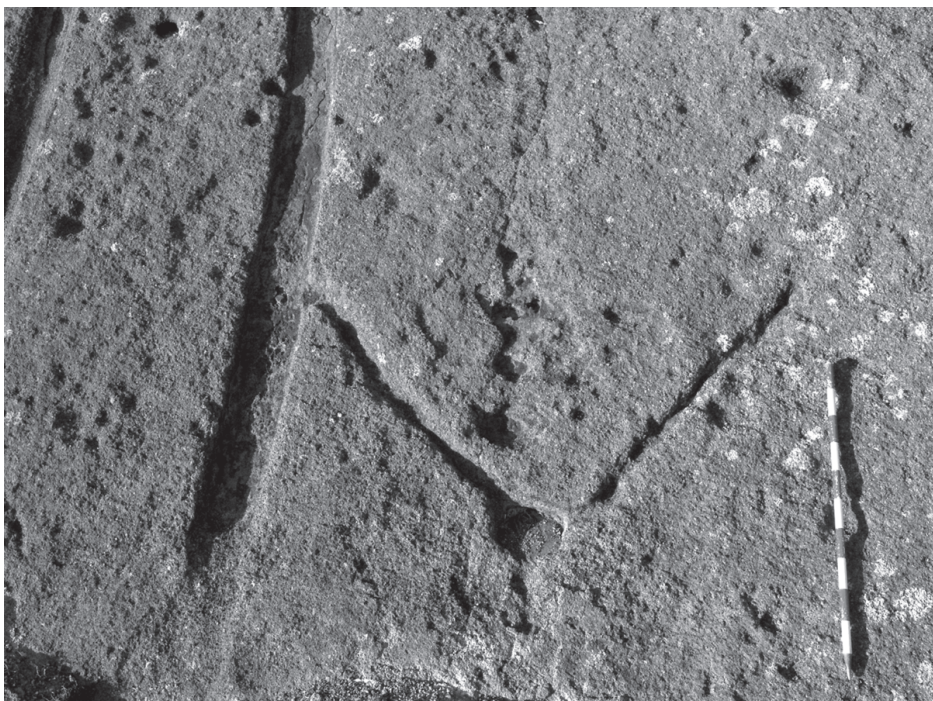
Foto 8. Detalle de una cazoleta con canalillos en los vértices y uno conecta con un canal de Guatisea.

combinados en el espacio inmediato, aunque no en los paneles, con las cazoletas con canalillos en sus vértices y/o lados.