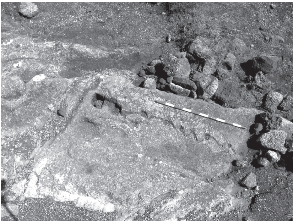
Foto 10. Vista general de un conjunto de cazoletas y canalillos de desarrollo serpentiforme de Tinastoria.

Documentamos las cazoletas con canalillos en sus vértices y/o lados que aparentan representar un tipo o simbología específica en 11 enclaves, en donde existe más de un centenar, los cuales adquieren variadas formas de cazoletas vinculadas con los canalillos desde los vértices, los lados o bien arrancan desde la parte superior en el caso de las cazoletas de forma circular. Generalmente se han desarrollado en suelos en pendiente donde los canalillos se sitúan en niveles más altos, existiendo ocasionalmente ejemplos en que surgen hacia cotas inferiores.