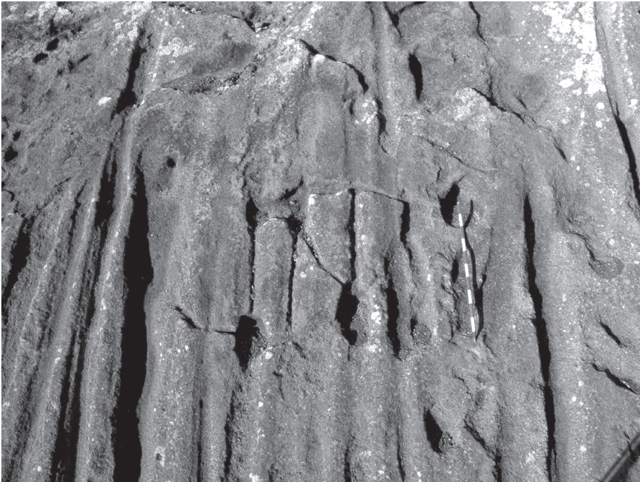
Foto 1. Detalle de un panel de canales con almogarén de montaña Guatisea.

canalillos en sus vértices, destacando algunas de ellas por su conexión a otras o bien a algunos de los canales.