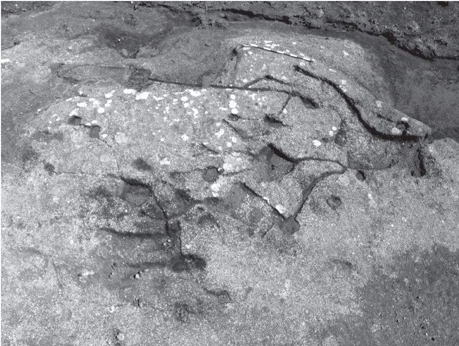
Foto 7. Vista general de un almogarán de montaña Tinasoria.

en que se encuentran en la ladera media de las montañas. Los canales se distribuyen en dos sectores, ya descritos en anteriores trabajos 19 y el canal del S1, de 4.79 m de largo, posee un ancho de 13 cm frente a los 30 cm de media de los canales del resto de los yacimientos. Igualmente la orientación contrasta, al dirigirse al norte-suroeste y no este-suroeste.