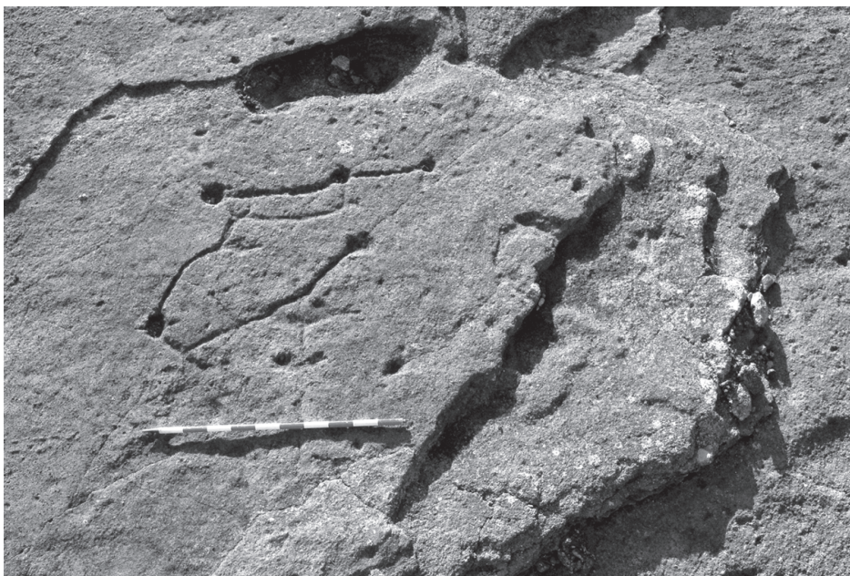
Foto 2. Vista general de dos motivos simbólicos de Guatisea.