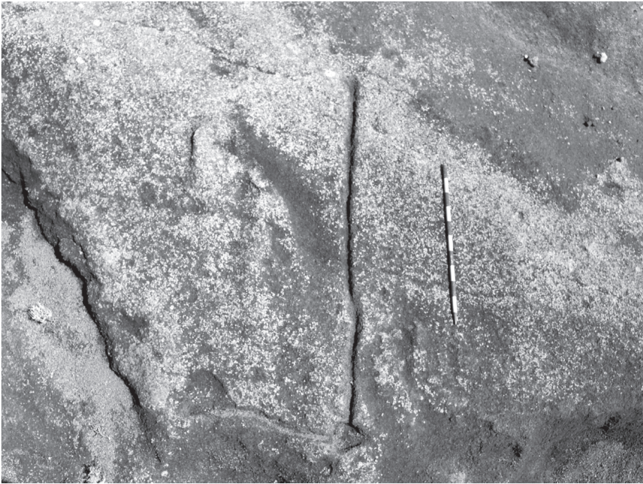
Foto 9. Vista general de dos cazoletas con canalillos en sus vértices de Tinasoria.

rrollo rectangular, conecta con el canal a través de diversos canalillos que en ocasiones siguen una trayectoria serpenteante. Si bien se conserva dañado por los trabajos de un sendero, se trata de uno de los que conocemos de mayores dimensiones, exceptuando el ya citado de la montaña Guardilama.