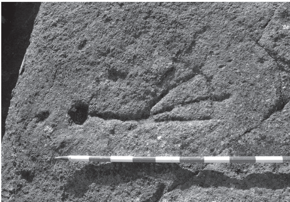
Foto 3. Vista general de un motivo simbólico de Guatisea.