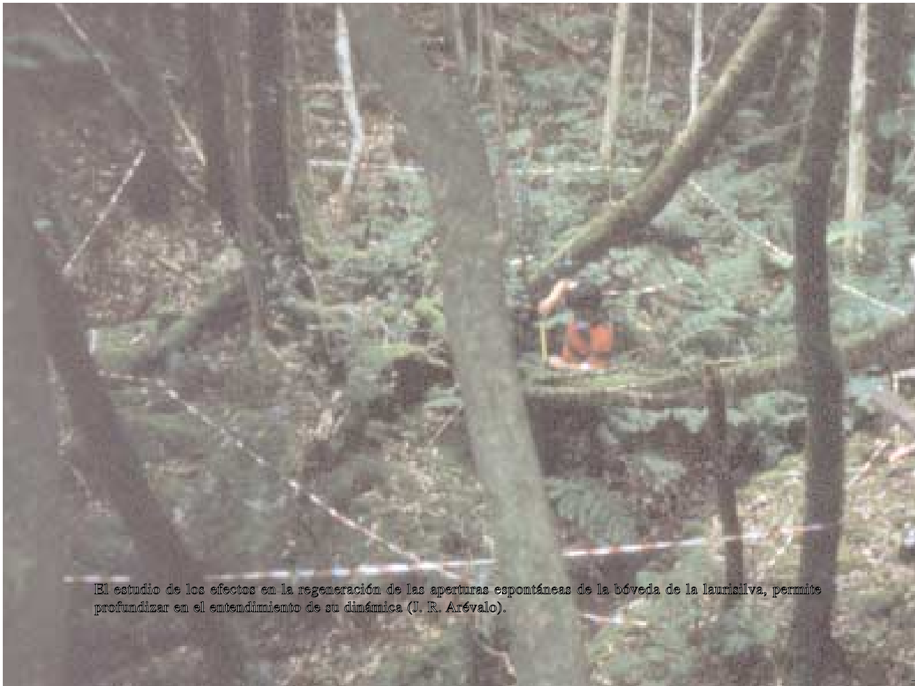
El estudio de los efectos en la regeneración de las aperturas espontáneas de la bóveda de la laurisilva, permite profundizar en el entendimiento de su dinámica (J. R. Arévalo).

Así mismo, la importante variedad de especies arbóreas que se puede encontrar en los bosques próximos a la madurez que