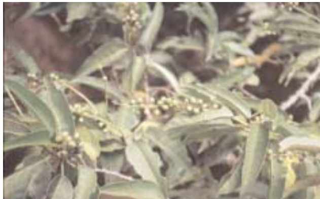
La hija ( Prunus lusitanica ), especie vecera, es decir, que fructifica sin patrón aparente, es el "gapmaker" más frecuente de la comunidad.

sólo es posible en condiciones propias de ambientes al margen de la bóveda, en donde la luz pueda llegar al suelo, y éste carezca de mantillo. Estas especies sólo pueden sobrevivir debido a los grandes claros que se forman y su papel es fundamentalmente el de recomponer la bóveda allí donde ésta desapareció. Una vez cerrada la bóveda, la germinación se ve impe-