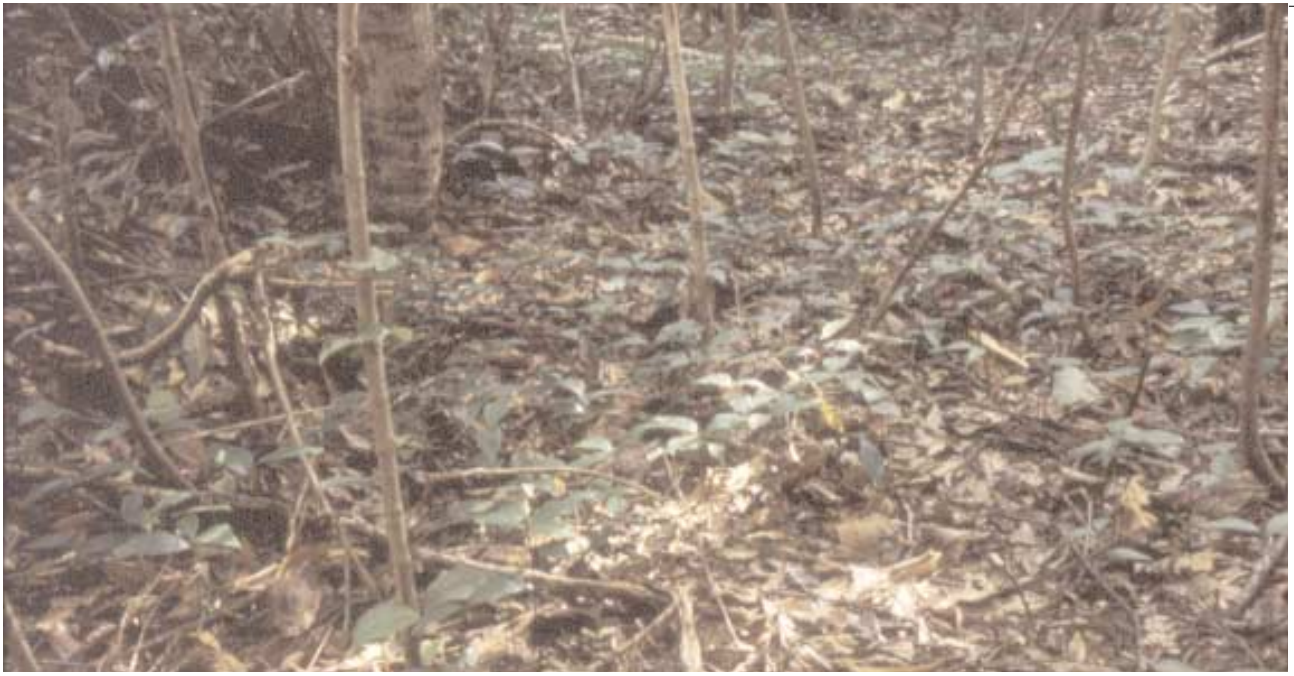
La capacidad de las lauráceas de producir simultáneamente bancos de chupones y de plántulas les confiere una indudable ventaja competitiva. En la foto, un banco de plántulas de loro ( Laurus novocanariensis ).