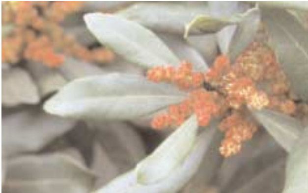
La faya ( Myrica faya ), especie dioica, juega un papel trascendental en la comunidad debido a su capacidad para fijar nitrógeno. En la imagen, un hayón (pie masculino) en flor.

didada por la sombra que proyectan sus propios adultos y por el mantillo que se acumula, y una vez que alcanzan su esperanza de vida comienzan a caer, inclinándose cada vez de una forma más evidente, hacia el suelo. Nunca rebrotan de cepa a no ser que hayan sido talados. Un caso puntual de esta estrategia pionera podría ser la adelfa de monte ( Euphorbia mellifera ), pero con la diferencia de que el banco de semillas existe sólo a escala