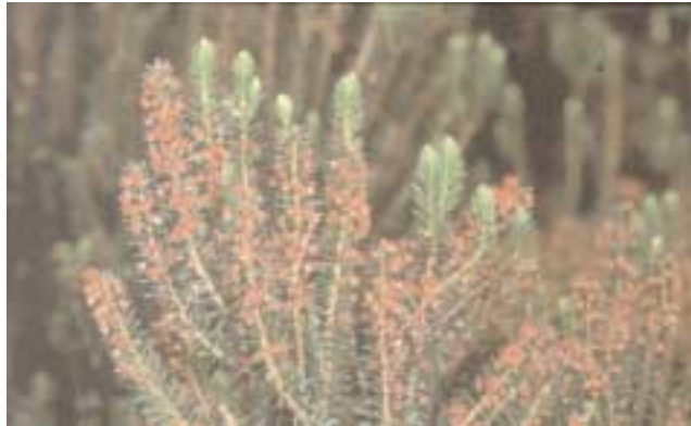
Las ericáceas juegan un papel fundamental en la reconstrucción del monteverde, pues poseen un banco de semillas que les permite germinar tras la apertura de una bóveda. En la imagen un tejo ( Erica platycodon ) en flor.

Encontrada fundamentalmente en el brezo ( Erica arborea ) y el tejo ( E. platycodon ), especies que presentan un importante banco de semillas. Son las únicas especies arbóreas del bosque con dispersión eólica, debido al escaso tamaño y peso de sus frutos, por lo que están en condiciones de llegar a cualquier esquina del mismo. La germinación de sus semillas