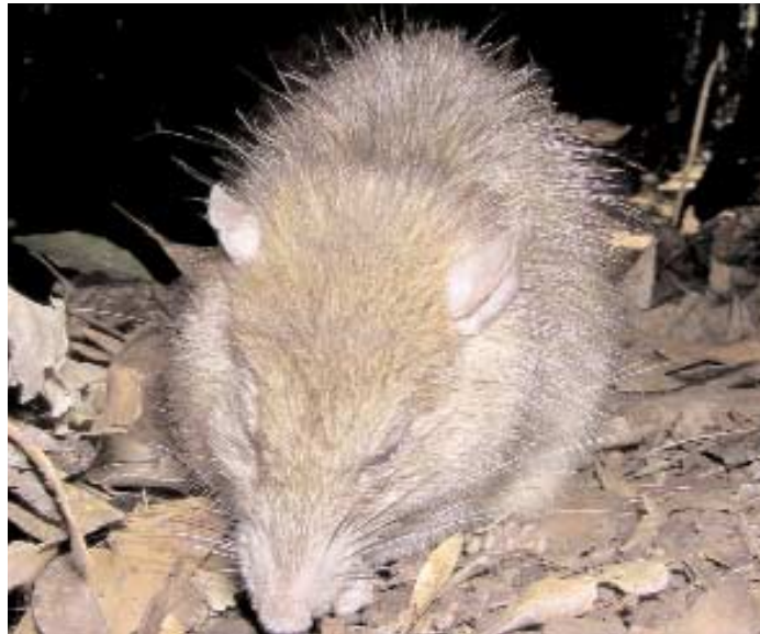
La rata negra ( Rattus rattus ), en la imagen, especie exótica a este bosque, amenaza la supervivencia de las palomas endémicas al preñar sobre sus huevos, amén de que al alimentarse de diferentes frutos interviene en la dinámica del bosque.

y pérdida de hojas a lo largo del año, sin que existan ritmos estacionales; la naturaleza recalcitrante de las semillas de sus árboles, típica de las especies tropicales, que con muy pocas excepciones ( Erica , Euphorbia ) no pueden formar bancos de semillas, ni preservarse en bancos de germoplasma, pues una vez sobre el suelo o germinan o mueren; la polinización mayoritariamente entomófila (por insectos), excepto Erica , frente a la más frecuente anemofilia (por el viento) de las especies arbóreas de las zonas templadas; la caulifloria o propiedad por la que las flores y frutos surgen en los tallos y no en inflorescencias en los ápices de las ramas, de algunas de sus especies constituyentes ( Pleiomeris , Heberdenia ) o finalmente, la disponibilidad permanente de recursos alimenticios para las aves frugívoras, pues las especies más importantes ( Laurus , Ilex , Myrica , Picconia , Persea ) fructifican todo el año sin fenología aparente, carácter propio de las especies tropicales, no sujetas a la estacionalidad del clima.