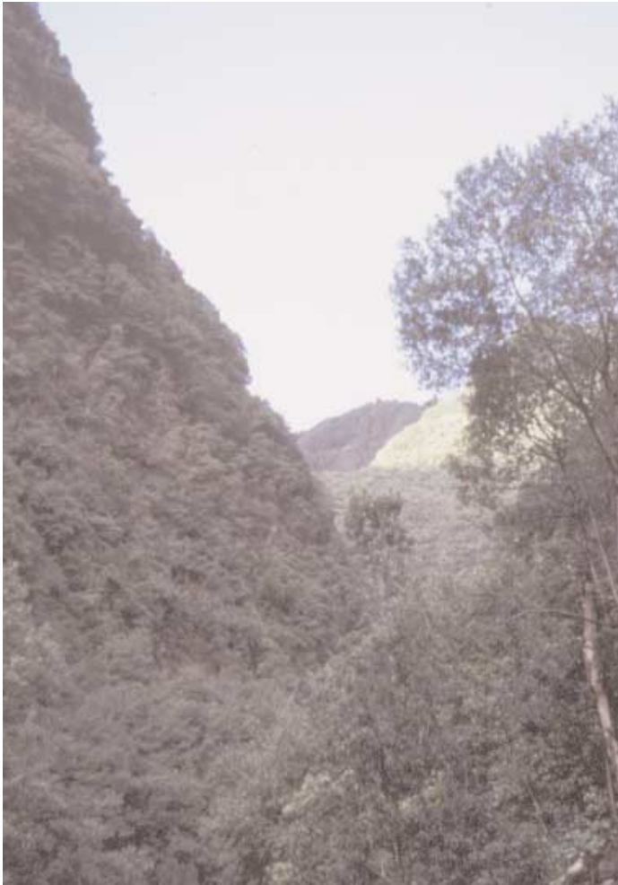
El relieve abrupto de las medianías, es el mejor aliado en la conservación de la laurisilva. En la foto el barranco de los Tiles en La Palma.

Hoy sabemos que la laurisilva está presente en los archipiélagos atlánticos desde hace 2 Ma (fósil datado en Madeira) y posiblemente desde hace bastante más. En estos archipiélagos, en los que también han tenido reflejo los grandes eventos del pasado europeo, este bosque tan peculiar ha podido subsistir de una forma relictual hasta nuestros días fundamentalmente por tres razones: a) el carácter atemperador del océano que nos rodea, que suaviza los episodios fríos y cálidos a los que se ha visto sometido el hemisferio boreal; b) la posi-