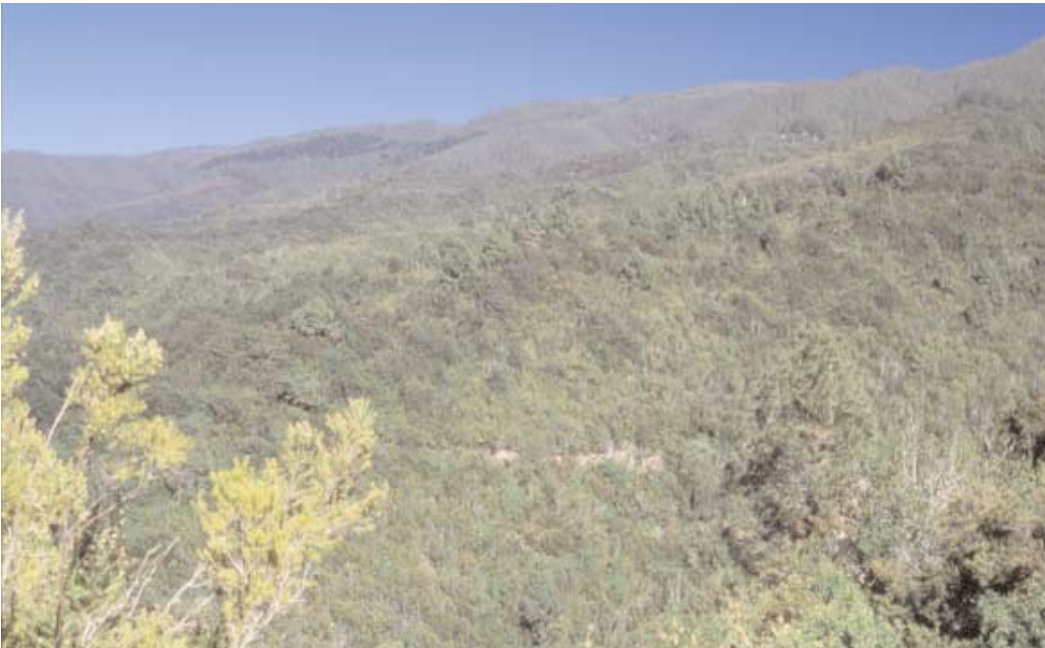
La Reserva de Las Palomas, en el norte de Tenerife, nos enseña cuál fue el aspecto de las medianías a barlovento antes de la Conquista.

cos la laurisilva europea fue siendo paulatinamente desplazada de este entorno, hasta encontrar un refugio seguro que le ha permitido sobrevivir hasta nuestros días en los archipiélagos referidos. Entre estos eventos podríamos incluir la crisis de Messina, que se produjo hace unos 5,3 Ma al cerrarse el Estrecho de Gibraltar, dando lugar a la desecación del Mediterráneo, las reiteradas glaciaciones del Terciario tardío y del Cuaternario, que motivaron la migración latitudinal de estos bosques, severamente impedida por la disposición en el sentido de los paralelos de los obstáculos geográficos europeos (Pirineos, Alpes, Cáucaso, Mar Mediterráneo), o la aparición hace unos 3 Ma del clima mediterráneo, que posibilitó el desarrollo de un nuevo bioma en la región mejor adaptado al nuevo clima, como es el bosque esclerófilo, capaz de soportar el intenso estrés hídrico del verano y el moderado estrés térmico del invierno. →