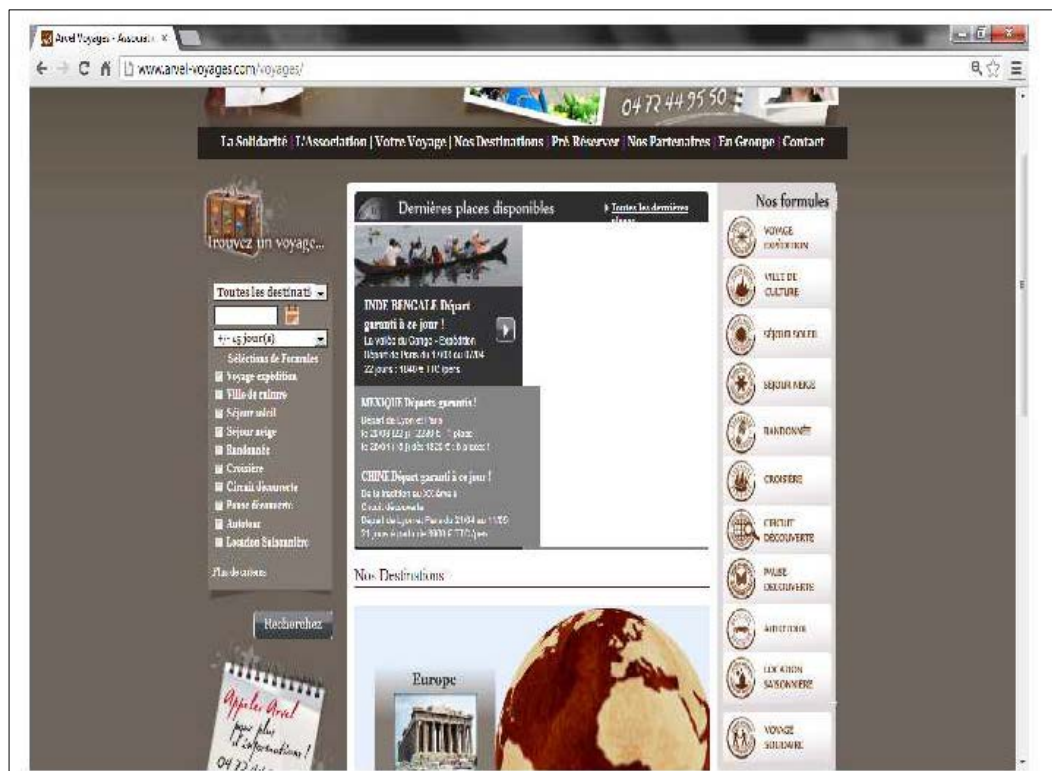
Figure 2. Menus horizontal et vertical du site www.arvel-voyages.com

Toutefois, cette distribution peut varier considérablement d'un site Web à l'autre. Dans l'exemple suivant, le site Web comporte deux menus : un menu horizontal sous la zone d'en-tête et un menu vertical à droite.