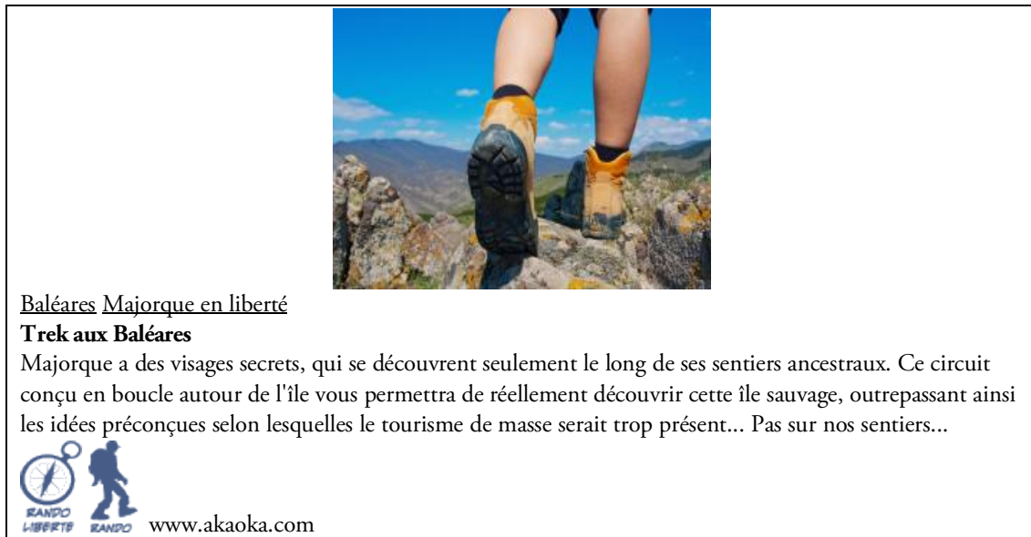
Figure 4. Offre de voyage