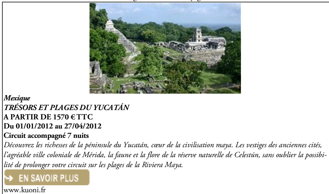
Figure 5. Offre de voyage

Ces deux exemples présentent les éléments qui comportent les offres de voyage de notre corpus : en tête d'annonce, les photographies de la destination et les titres, au centre, les slogans et, en fin d'annonce, les liens vers des informations complémentaires