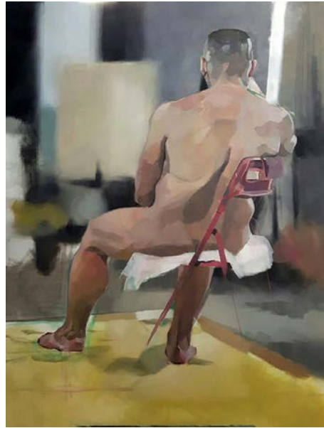
Fig. 7. Marie Sellet Cubillo, óleo, 116 x 89 cm, 2018.

El problema a resolver no se suele limitar a pintar lo que se ve, tal y como se puede apreciar, sino también, y esto es más difícil de lograr, se trata de que la imagen bien resuelta se adapte a la sensibilidad del autor. Puede suceder que un pintor que domina su lenguaje no encuentre en él los recursos necesarios para expresar un contenido concreto, por lo que tendrá que innovar, y es entonces cuando, en ocasiones, se crean nuevas formas de expresión 13 .