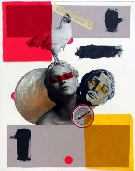
Fig. 8. Martina Armas, 41 x 33 cm, 2017.