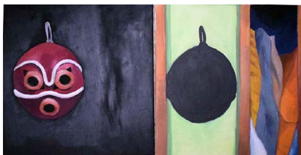
Fig. 4. Briseida Hernández Delgado, Sin título , óleo sobre lienzo, díptico, 40 × 40 cm c/u, 2017.