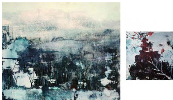
Fig. 5. Elisa García Dorta, Sin título , óleo y acrílico sobre tabla, díptico, 54 × 65 cm y 30 × 30 cm 2017.