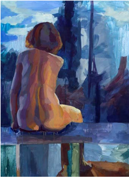
Fig. 6. Sara Vela, óleo, 130 x 89 cm, 2015.