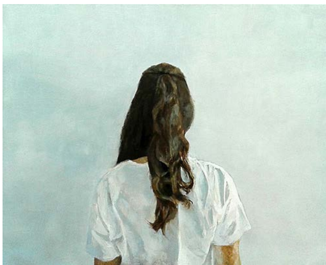
Fig. 2. Irene Morales Almeda, Sin título , óleo sobre lienzo, 65 × 81 cm, 2017.

cos como Los desposorios de la Virgen , de Rafael. A veces se aprecia como bella una obra con un orden menos claro, aunque su estructura se asiente en relaciones simétricas y diferentes tipos de proporción, sobre todo la sección áurea, tan presente en el crecimiento de los seres vivos. Pero, a mi juicio, el placer estético implica muchos otros aspectos además de la relajada percepción del equilibrio y la regularidad. Esto tiene que ver con el contenido emotivo que es capaz de transmitir una imagen y que depende también de otros factores, como nuestra memoria filogenética y la complejidad en el uso del lenguaje. Así, en el caso de la pintura, podría entenderse como bella una sofisticada armonía cromática o una sutil matización de la luz. Ello explica que la aparente sencillez de una obra de Morandi no sea simple en absoluto, ya que da fe de una fina sensibilidad en la que el artista ha podido profundizar gracias al ejercicio de la pintura.