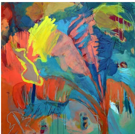
Fig. 1. Federica Furbelli, Surga hilang , acrílico, cera y espray sobre tabla, 122 × 122 cm, 2018.