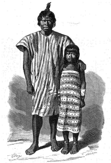
El cacique Caracatuí, y su hijo. (El grabado es reproducción de una fotografía).

en ambos textos se da prioridad a lo narrativo frente a lo descriptivo, minimizándose la descripción y poniéndola al servicio de la trama; en este sentido, los dos textos adoptan características formales de la narrativa de ficción, como pueden ser la inclusión de diálogos, la dosificación de cierta intriga o la presencia de un desenlace preñado de un mensaje a modo de conclusión o cierre; aunque ambos textos pudieron ser leídos en la época como verídicos, lo cual los sitúa dentro de lo que se entendía en el siglo XIX como literatura de viaje 11 , una lectura crítica adivina en las dos narraciones un importante componente de ficción, una confusión premeditada entre lo factual y lo imaginario que, pensamos, pretendía aportar credibilidad a todos los pasajes ficticios; por último, los dos textos presentan una visión positiva del indígena, algo bastante insólito en la literatura de viaje de su tiempo 12 .