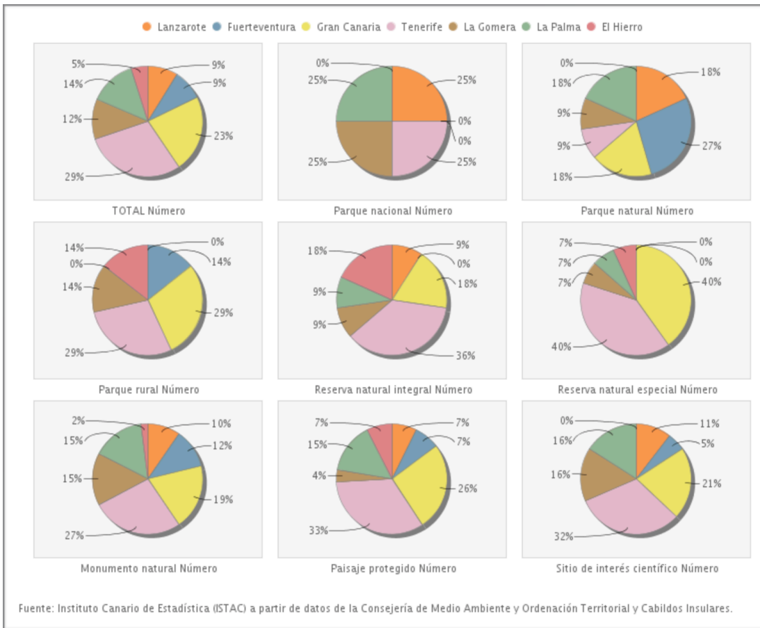
Gráfica 3.