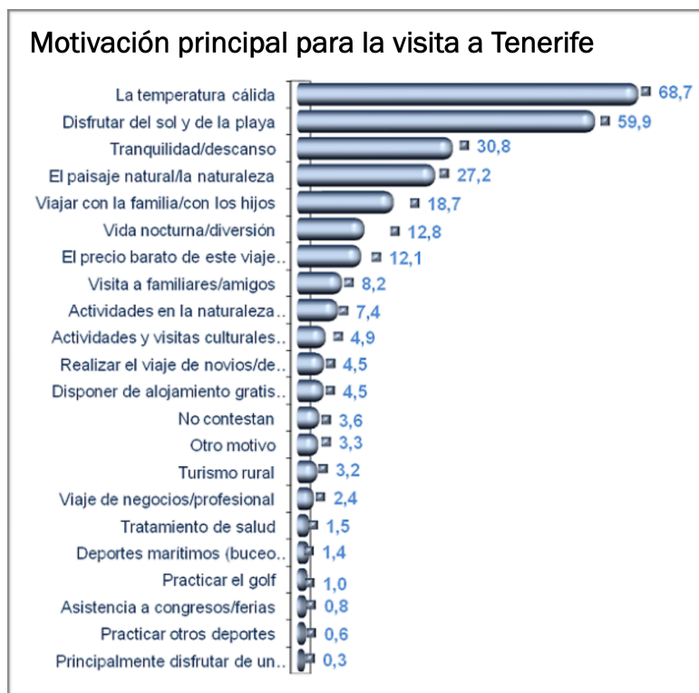
Gráfica 2.