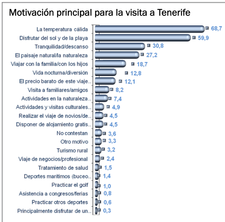
Gráfica 2.