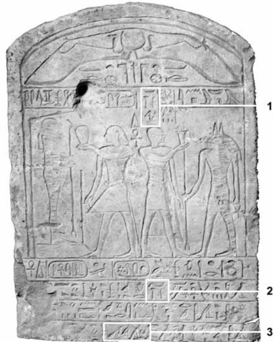
Figura 1. Estela de Seankhiptah 1: Nebsumenu

La segunda fase de la investigación nos ha hecho contemplar la pieza de forma extrínseca. Desde este punto de vista ya habíamos reconocido paralelos epigráficos en la grafía de algunos de los signos, así como paralelos iconográficos en otras estelas del periodo. Sin embargo, un documento que no habíamos tenido aún en cuenta en trabajos previos nos ha sido de excepcional ayuda a la hora de entender y contextualizar correctamente la estela de Madrid. Se trata de la Estela C13 del Museo del Louvre, elaborada bajo el reinado de Nubkhaes A, reina de la dinas-