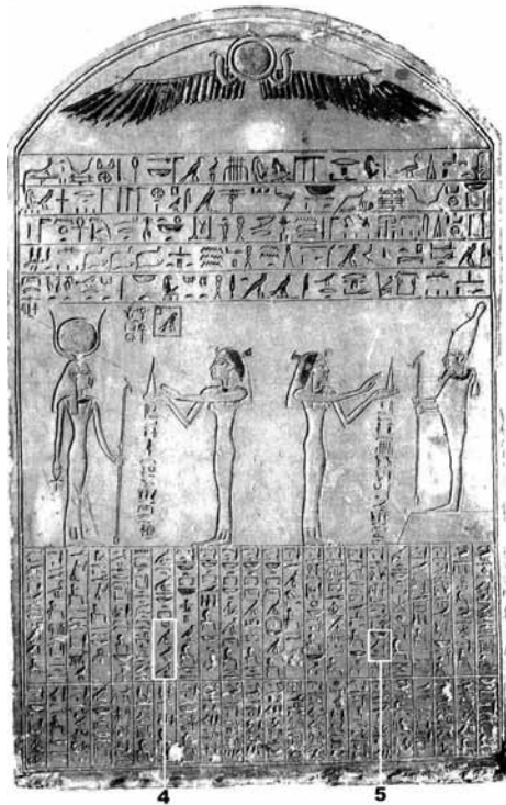
Figura 2. Estela de Nubkhaes 4: Hemu