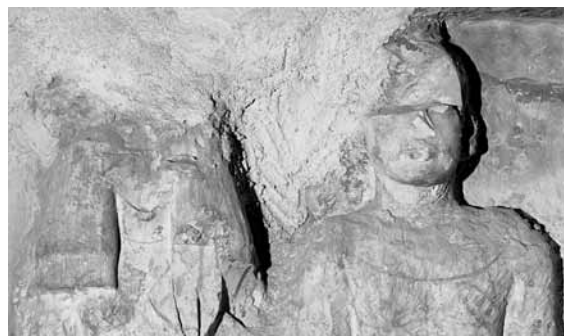
Figura 2. Estatuas de los padres (?) de Neferhotep. Detalle

En la capilla de culto, Iwy puede ser identificada con la dama ubicada detrás de la pareja