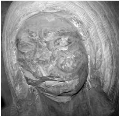
Figura 6. Detalle de la estatua de Neferhotep

tado como un anciano, con la cabellera blanca, arrugas en el rostro y un vientre prominente y con pliegues (fig. 6).