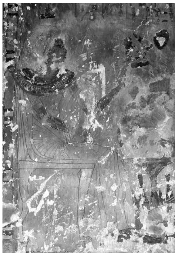
Figura 3. El abuelo de Neferhotep

También es lógico asociar las estatuas secundarias con los pozos funerarios a los