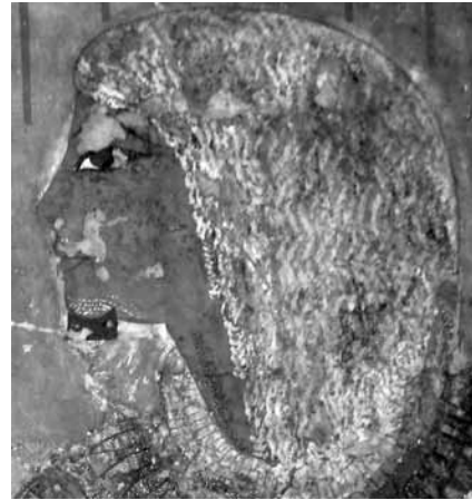
Figura 5. Neferhotep. Detalle de la escena de ofrenda a Ra Harajty

El retrato figurativo de la vejez no es común en el arte funerario egipcio. Sin embargo, su frecuencia se hace mayor en época ramésida y las figuras de TT49 constituyen su antecedente directo 36 . En el monumento de Neferhotep no dudamos en considerar que de manera intencional su cabeza fue representada con la blancura de las canas que daban cuenta de su edad y de su condición de par coetáneo de su