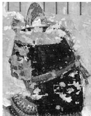
Figura 4. La madre (?) de Neferhotep. Detalle de la ofrenda a Ra Harajty

En cuanto a los miembros femeninos de la familia de Neferhotep documentados en su tumba, además de su mujer Merytra su madre Iwy fue retratada en el relieve del dintel de la entrada a TT49 y en la escena pintada en el segundo pasaje, como así también en el grupo escultórico del nicho S de la capilla del ka. En estos casos las inscripciones dan certeza de su identificación, que también puede sugerirse en otro, de acuerdo al tratamiento figurativo de una de las mujeres que componen la escena de ofrenda a Ra Harajty (lado S de la pared E de