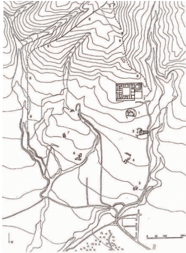
1. Βεργίνα. Τοπογραφικό σχέδιο. 1: θέατρο, 2: ανάκτορο, 3: ιερό Εὐκλείας - αγορά, Drougou, 1997: 300-301.

χρονολογείται στο β' μισό του 4 ου αι. π.Χ., εποχή δημιουργίας στον ελληνικό κόσμο των παλαιότερων λίθινων θεάτρων (Δρούγου, 1999: 28· Δρούγου, 2017: 92-93, 97-98· Δρούγου - Καλλίνη, 2014-2015: 494, 506). Παράλληλα, γειτονεύει ακριβώς βόρεια με την πολιτική αγορά της πόλης προς την οποία είναι προσανατολισμένο 7 (Drougou, 1997: 282). Βασική ιδιομορφία του κοίλου είναι η ύπαρξη της πρώτης και μοναδικής λίθινης σειράς εδωλίων ενώ στη συνέχεια αναπτύσσεται χρησιμοποιώντας τη φυσική πλαγιά. Επιπλέον, το δεδομένο της ακατάλληλης γεωμορφολογικά θέσης για μια τέτοια κατασκευή σύμφωνα με τις αρχαίες πρακτικές, υποδεικνύει ότι ειδικοί λόγοι επέβαλαν τη συγκεκριμένη επιλογή, κυρίως για τη διασφάλιση τοπογραφικής και λειτουργικής σχέσης του θεάτρου με το ανάκτορο και την αγορά. Σε αυτό συνηγορούν οι αρχιτεκτονικές ιδιομορφίες που παρουσιάζει, ορισμένες από τις οποίες, πιθανόν, διευθετήθηκαν με τεχνικές λύσεις για την προσαρμογή του στο φυσικό ανάγλυφο. Φαίνεται, λοιπόν, ότι το ανάκτορο και το θέατρο αποτέλεσαν ένα ενιαίο αρχιτεκτονικό σύνολο (Nielsen, 1994: 81) που συγκέντρωσε τις βασιικές λειτουργίες της βασιλικής κατοικίας και της πόλης. 8