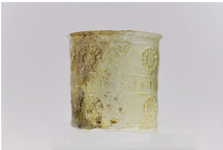
Εικ. 4β. Κύπελλο Γ91.

1944-45:94). Αναφέρεται επιπλέον ένα θραύσμα που σώζει τμήμα επιγραφής [HN], από τάφο στην Ιερουσαλήμ στο μουσείο Rockefeller, κατασκευασμένο από αμφιλεγόμενη μήτρα. Εάν είναι τμήμα της λέξης THN το κύπελο ανήκει στην παραλλαγή με κανονικό N , ενώ αν είναι η κατάληξη της λέξης NEIKHN , το κύπελλο είναι κατασκευασμένο από την μήτρα με το ανάποδο N . 13