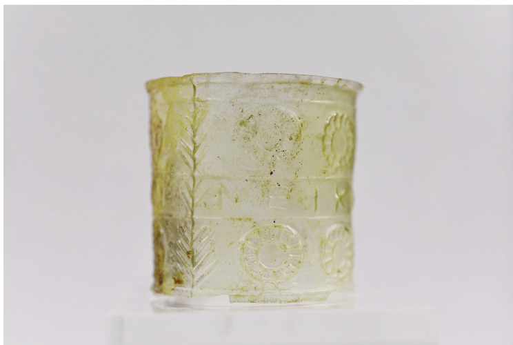
Εικ. 4γ. Κύπελλο Γ91 (ΕΦΑ Χαλίων - Δ. Τομαζινάκης).