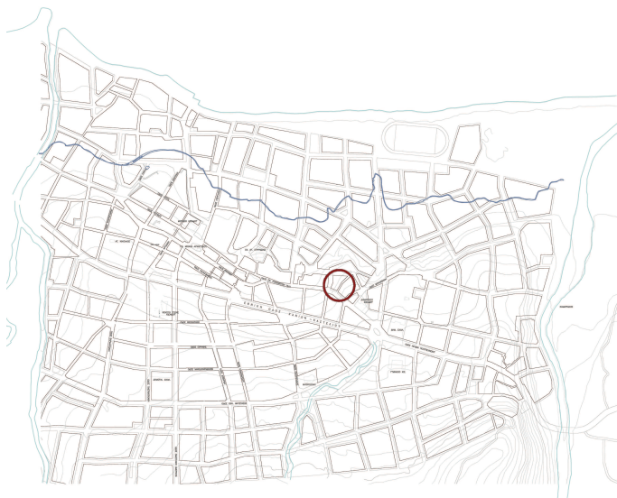
Εικ. 2. Απόσπασμα χάρτη της πόλης με τη θέση του νεκροταφείου.

Τεχνική: Εμφύσηση σε μήτρα. Χύτευση με χρήση κλειστής τριμερούς μήτρας, στο εσωτερικό της οποίας υπάρχει εσώγλυφος διάκοσμος, που αποτυπώνεται στην εξωτερική επιφάνεια του παραγόμενου αγγείου. Η μήτρα αποτελείται από δύο κάθετα κοίλα τμήματα που ενώνονται σε επίπεδο πυθμένα και τη βάση. Η τεχνική της πολυμερούς μήτρας εφευρέθηκε και εξελίχθηκε, προκειμένου να παραχθούν προϊόντα που μιμούνται μετάλλια πρότυπα με σφουρήλατο διάκοσμο. 7