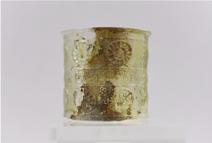
Εικ. 4α. Κύπελλο Γ91.

με κύριο διακριτό χαρακτηριστικό το ανάποδο N στη λέξη THN , ένα σύνθετος λάθος κατά τη χάραξη του γράμματος στη μήτρα, με αρκετά παραδείγματα να έχουν βρεθεί ενώ στη δεύτερη υποκατηγορία με το σωστό N να είναι καταγεγραμμένα ελάχιστα (Stern, 1995: 98-99· Whitehouse, 2001: 26).