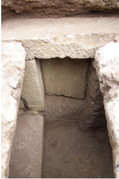
Εικ. 3. Άποψη του τάφου από την οροφή (ΕΦΑ ΧΑΝΙΩΝ).

τρεις φορές σε κάθε πλευρά. Από ένα κάθετο κλαδί φοίνικα στις δύο διαμετρικά αντίθετα πλευρές του, κρύβει την γραμμή της κατακόρυφης ένωσης κατά μήκος των κομματιών της τριμερούς μήτρας, από το χείλος στη βάση. Η επιγραφή ΛΑΒΕ ΤΗΝ ΝΕΙΚΗΝ είναι γραμμένη ανορθόγραφα, με σύνθημα υπέρ της επιτυχίας του χρήστη. Το ορθογραφικό λάθος της φράσης εξηγείται στο πλαίσιο ενός φωνητικού φαινομένου, τον Ιωτατισμό, που παρατηρείται στην ύστερη ελληνιστική εποχή, όπου οι απλοί άνθρωποι μπερδεύουν τα ομόηχα φωνήεντα ή διφθόγγους, συγχέοντας συχνά το ι με το ει .