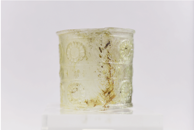
Εικ. 4ε. Κύπελλο Γ91.