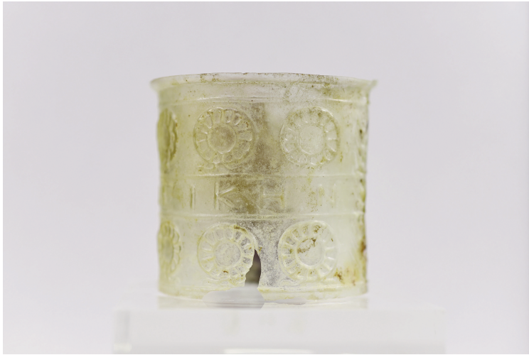
Εικ. 48. Κύπελλο Γ91 (ΕΦΑ Χανίων - Δ. Τομαζιζνάκης).