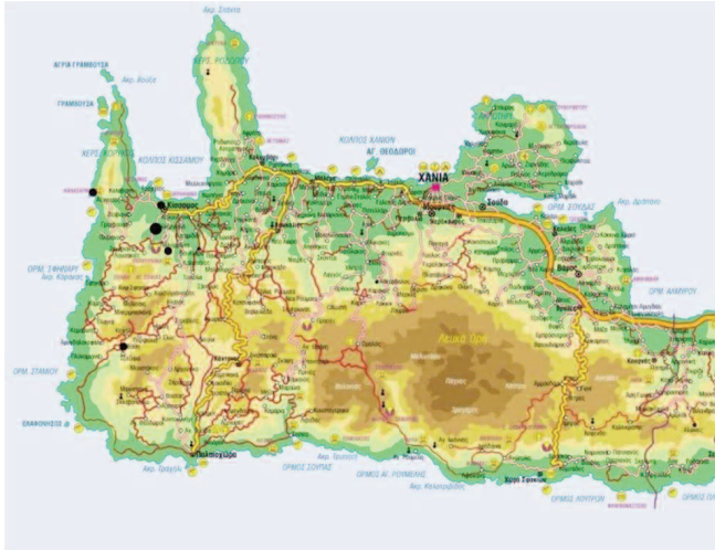
Εικ. 1. Χάρτης.

νεκρικό ένδυμα, ενώ τα χάλκινα αποτμήματα και τα μολύβδινα ελάσματα αποτελούσαν επένδυση ξύλινων κιβωτιδίων και άλλων εξαρτημάτων, αντίστοιχα. Από τη μέχρι σήμερα συντήρηση του υλικού έγινε δυνατή η ταύτιση περισσότερων από σαράντα γυάλινων αγγείων, τα οποία σώζονται σε αποσπασματική κατάσταση. Αναγνωρίστηκαν αγγεία μυροδόχα και κύπελλα, η πλειονότητα των οποίων ανήκει σε κοινούς και διαδομένους τύπους με την τεχνική του ελεύθερου φυσήματος, που εμφανίζονται και επικρατούν από το 1 ο αι. μέχρι τον 3 ο αι. μ.Χ., στην Κρήτη και σε ολόκληρη τη λεκάνη της Μεσογείου. Μεταξύ των αγγείων απαντούν χυτροειδή κύπελλα, σφαιρικά με ευρύ χείλος και κοντό λαιμό 6 και τετράπλευρα με καμπυλωτά περιγράμματα και ελλειψοειδείς εμβάθυνσεις ενώ ξεχώρισε το άωτο κυλινδρικό κύπελλο με την ανάγλυφη διακόσμηση. Βρέθηκε τοποθετημένο όρθια στην περιοχή του κρανίου στο βόρειο θρανό του τάφου, όπου εκεί διαπιστώθηκε ότι τα οστά ανήκουν σε δύο τουλάχιστον σκελετούς (ταφή 2, Α7).