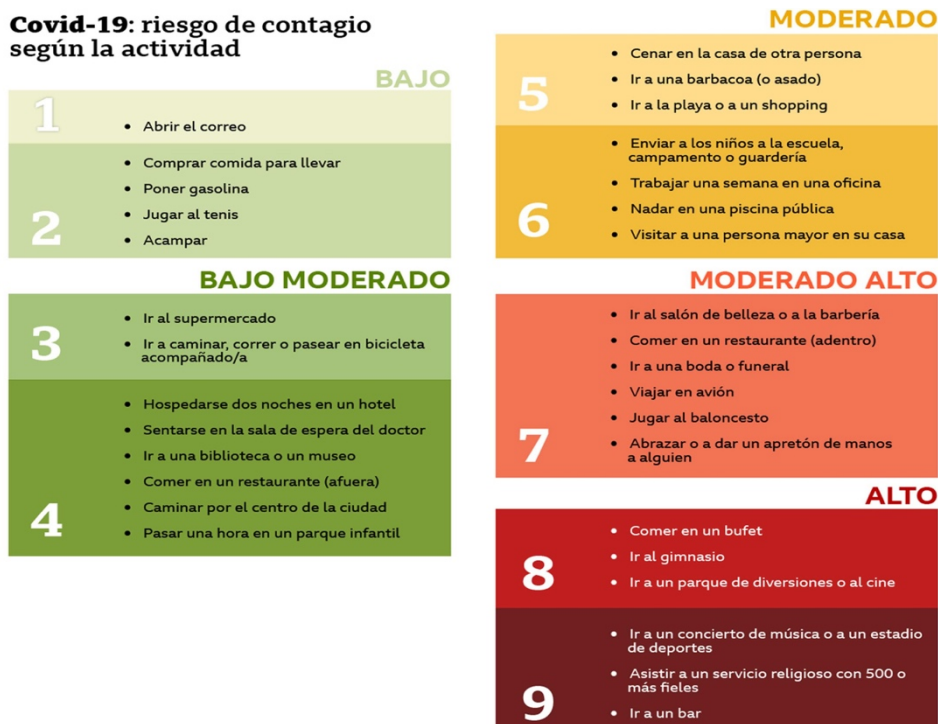
Gráfico: Web de la BBC https://www.bbc.com/mundo/noticias-54014422 Fuente: Texas Medical Association

En la mayoría de las empresas, independientemente del sector de actividad a la que se dedican, existen oficinas donde se realizan tareas administrativas y la prevención de riesgos laborales en estas tiene ahora un factor aún más importante. Como se indica en el estudio de la Asociación Médica de Texas, trabajar durante una semana en un edificio de oficinas implica un riesgo moderado de 6 sobre una escala de 10, por lo que el riesgo tiende a aumentar cuanto más tiempo se permanezca en una oficina.