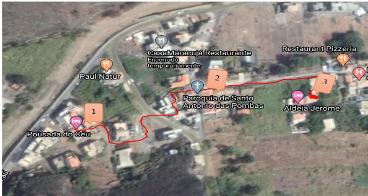
Ilustración 15- Circuito dentro del rasgo 1 del itinerario- Elaboración propia, Mapa extraído de Google Maps

Leyenda: 1- Pousada do Céu; 2- Parroquia de Santo Antonio; 3- Aldeia Jerome.