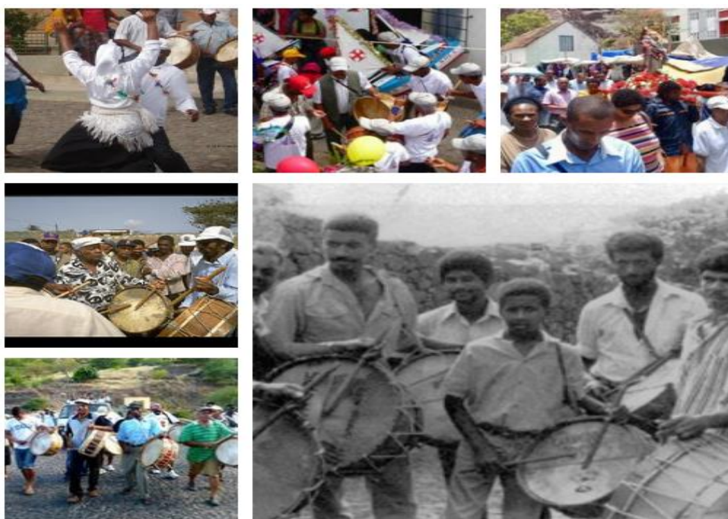
Ilustración 5- Celebración de San Pedro

En la composición de ilustraciones siguiente se puede apreciar un conjunto de fotografías de la celebración de São Pedro.