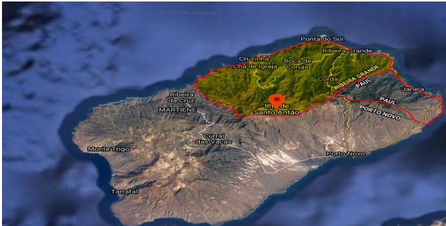
Ilustración 2- delimitación del Municipio de Ribeira Grande, elaboración propia – Fuente – (Google maps)