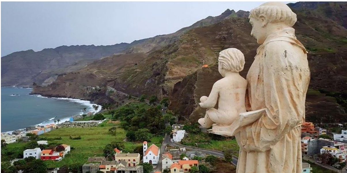
Ilustración 20- Estatua del Santo Antonio das Pombas