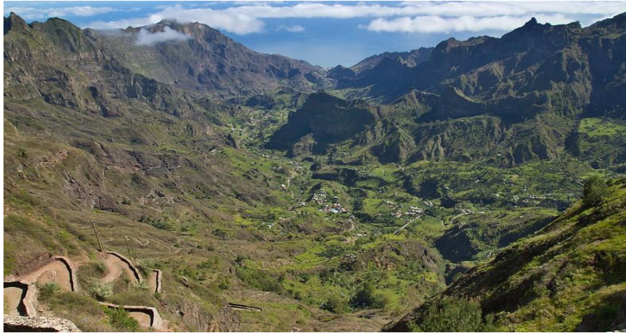
Ilustración 17- Mirador de Paul