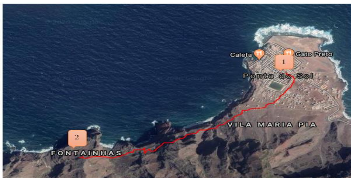
Ilustración 12- Circuito Ponta do Sol – Fontainhas (elaboración propia., Mapa extraído de Google Maps)

Leyenda – 1- Ponta do Sol; 2- Fontainhas