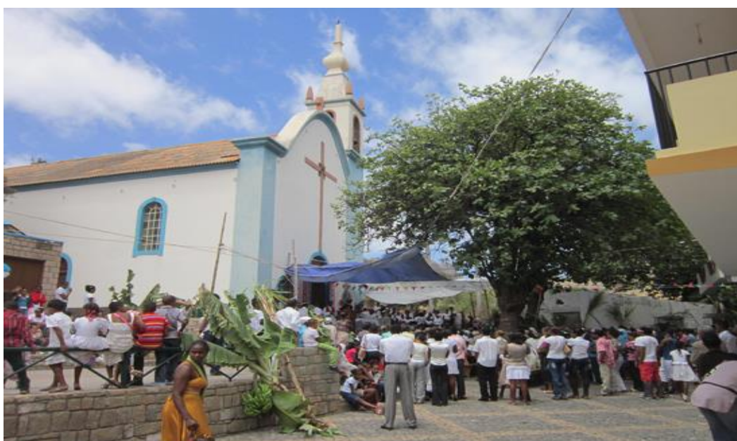
Ilustración 6- Misa de Santa Cruz, en la Parroquia de Santo Crucifixo.

En la fotografía inferior, se puede apreciar el momento en que se realiza la misa en la parroquia de Santo Crucifixo.