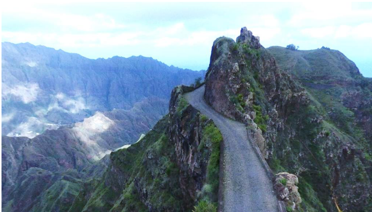
Ilustración 1- Delgadinho, Santo Antão