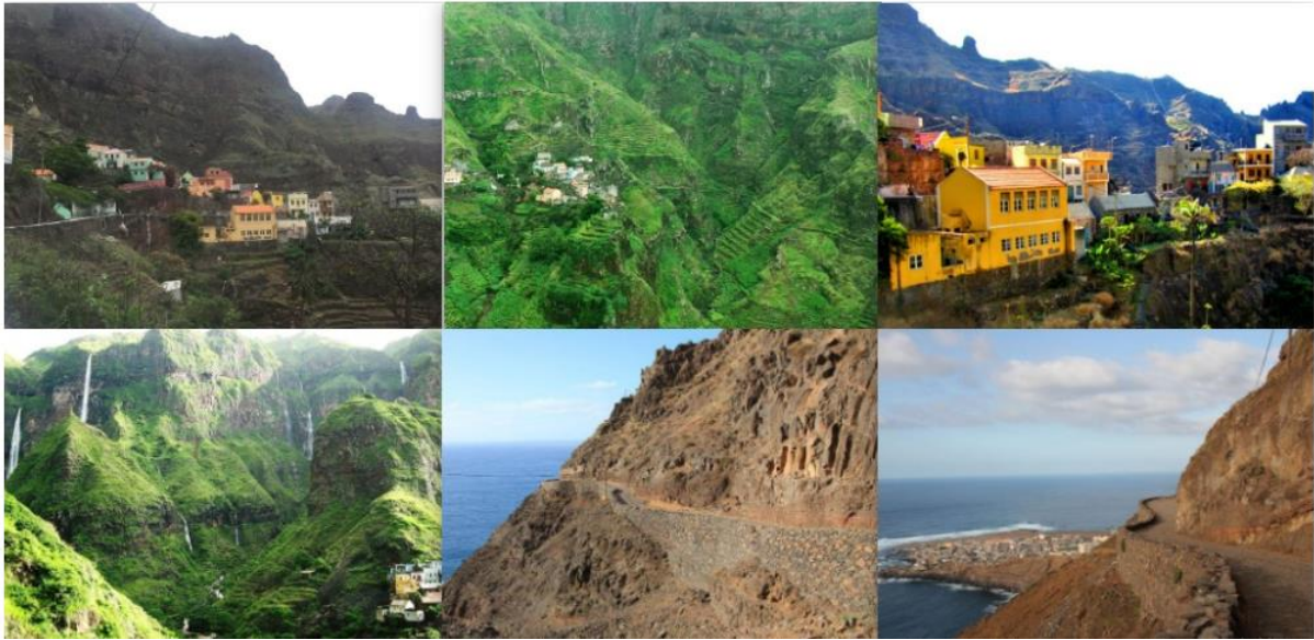
Ilustración 13- fotografías del circuito (Ponta do Sol- Fontainhas) – Autor desconocido, fuente – Ayuntamiento de Ribeira Grande