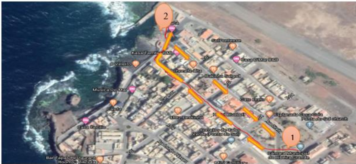
Ilustración 11- Recorrido dentro de la villa de Ponta do Sol

El circuito representado en la Ilustración anterior tendrá una duración de una hora. Se pretende realizar una pequeña visita al Ayuntamiento para conocer un poco sobre la historia de la villa y del pequeño puerto denominado “Boca de Pistola”. El objetivo es seguir adelante con el itinerario, atravesando la parte litoral, por el camino de senderos hasta llegar a Fontainhas.