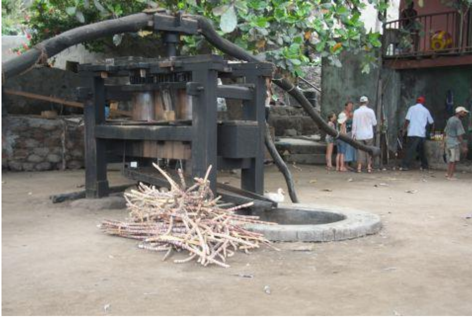
Ilustración 19 - Trapiche de Paul