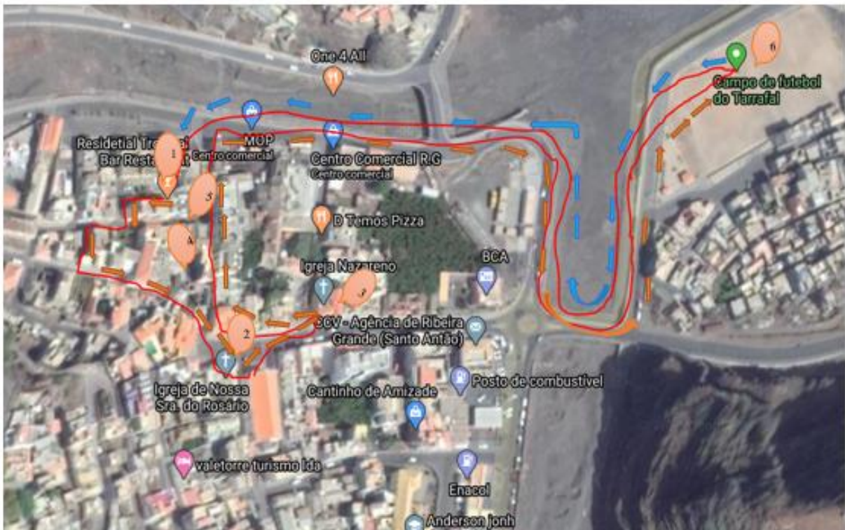
Ilustración 9- Circuito dentro de la ciudad de Ribeira Grande- Fuente – elaboración propia, mapa extraído de Google Maps