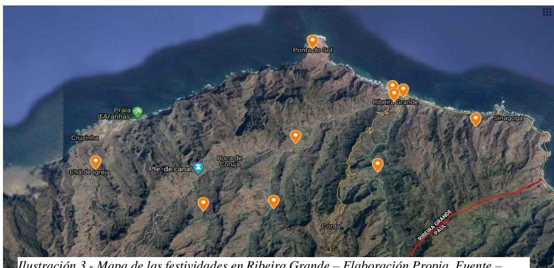
Ilustración 3 - Mapa de las festividades en Ribeira Grande – Elaboración Propia, Fuente – (Untitled map).