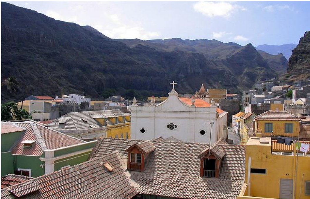
Ilustración 10- Ilustración 10- Ciudad de Ribeira grande - Autor - Travis Ferland

De acuerdo con la Ilustración 12, el recorrido empieza en la residencial tropical y termina en el campo de Tarrafal, donde se realiza la actividad principal del hito 1.