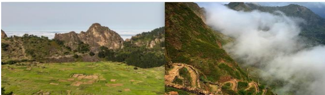
Ilustración 18 - La Caldera volcánica y el mirador