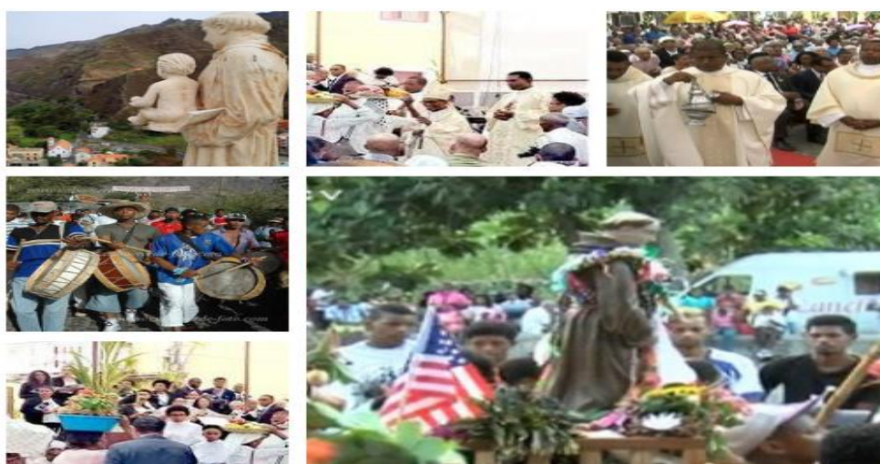
Ilustración 8 - imágenes de la celebración de Santo Antonio das Pombas

Durante la celebración del santo patrón, se realizan diversas actividades y exposiciones en las calles de la ciudad, como ejemplo son las ferias de artesanía y la presentación de grupos de música que cantan ritmos locales, expresando la singularidad del Criollo de la isla “Lengua de São Antão”. Así como en otras festividades religiosas de otros municipios de Cabo Verde, hacen la carrera de caballo, que también es un símbolo de la festividad. En la ilustración siguiente, se pueden ver fotos de la celebración de Santo Antonio.