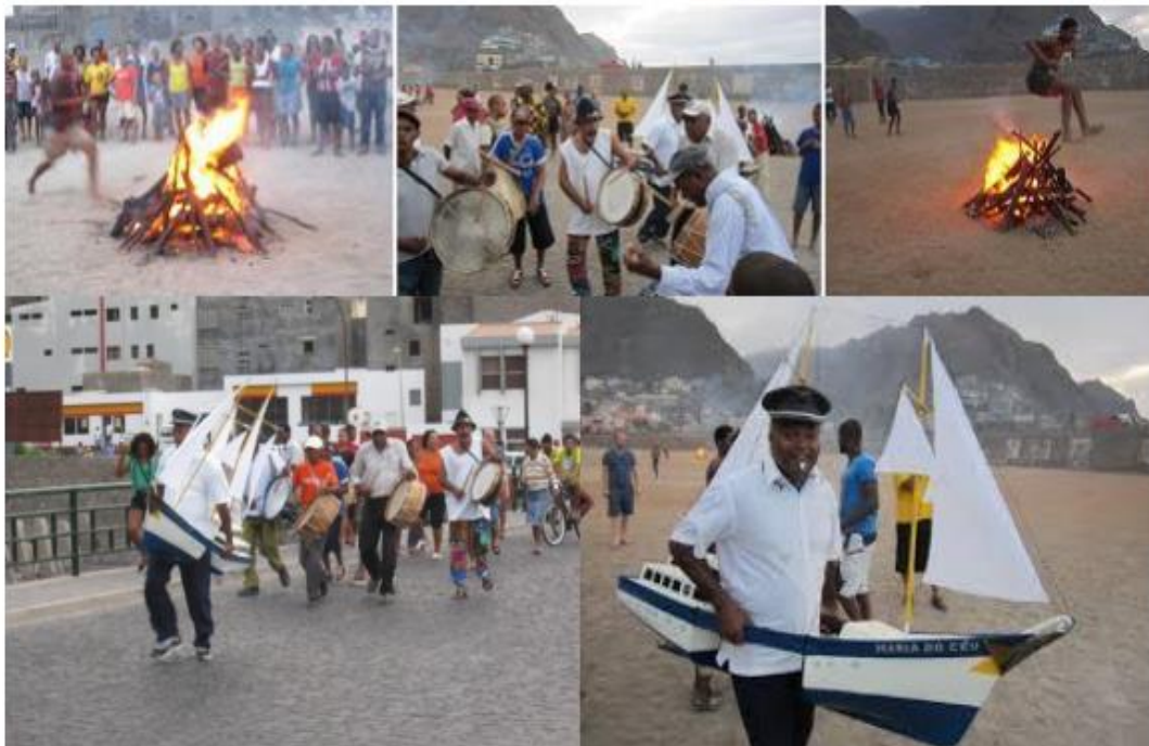
Ilustración 4- imágenes de la celebración de la fiesta de San Juan en Ribeira Grande

En la composición de imágenes siguiente, se puede apreciar cómo se hace el salto de la hoguera, los tambores y el silbato.