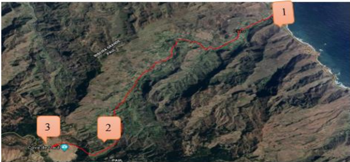
Ilustración 16 - Recorrido Villa das Pombas- Cova, Hito 2 Elaboracion Propia – Mapa extrido de Google Maps