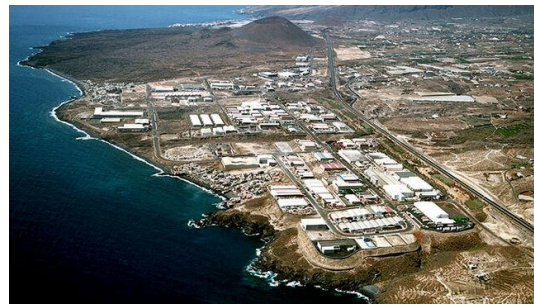
Polígono Industrial del Valle de Güímar - Tenerife

Con estas comparativas esperamos que el alumnado comprenda las singularidades del territorio canario para el desarrollo de los diversos sectores económicos.