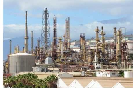
Imagen 4: R__n__