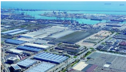
Polígono Industrial y Zona Franca de Barcelona