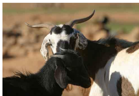
Imagen 2: Q _ _ s _ d _ C _ _ r _