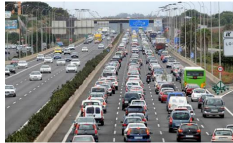
Imagen 6: A__t__i__