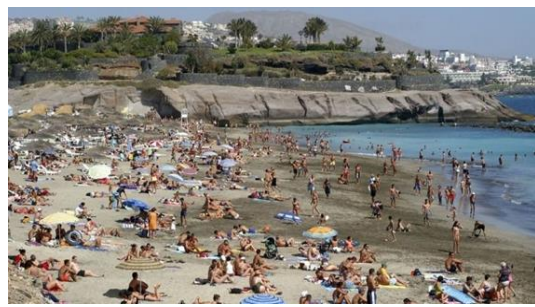
Imagen 10: S_o__y P__y__