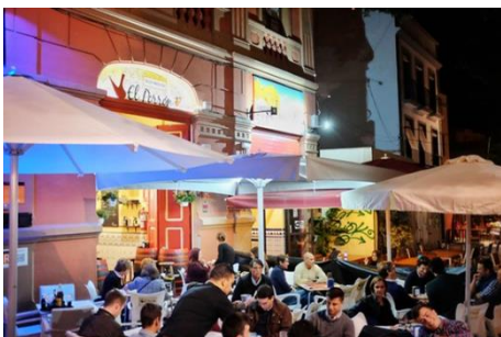
Imagen 9: C__d__F__i__n