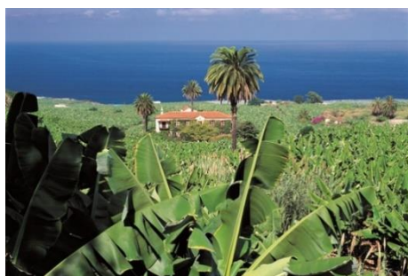
Imagen 1: P _ _ t _ _ _

Mientras se expone las imágenes se comprobará el grado de conocimiento que poseen sobre los sectores económicos y que debieron haber adquirido en el criterio de evaluación 6, con la finalidad de reforzar los aspectos en los que se compruebe que hay deficiencias de aprendizaje.