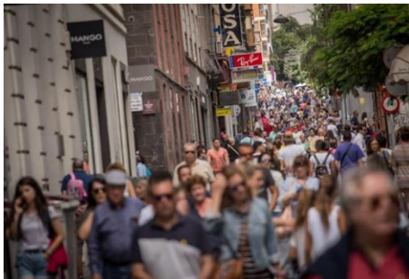
Imagen 7: P__q__C__e__