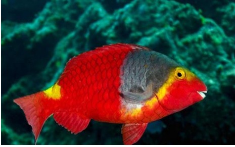
Imagen 3: V__j_