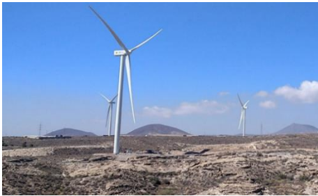
Imagen 5: M__n__d__v__o