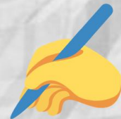
FIGURA 3. CUESTIONARIO INTRODUCTORIO. ELABORADO CON EL PROGRAMA CANVA