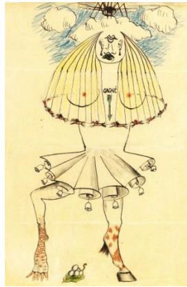
FIGURA 2. CADAVER EXQUISITO. MAN RAI, MAX MORISE, ANDRÉ BRETÓN, YVES TANGUY.

consiste, básicamente, en escribir una frase o realizar un dibujo, doblarlo dejando que se viera solo una parte del dibujo o el final de la frase y pasarla a un siguiente participante, para lograr mezclas de ideas o formas que pueden o no ser concretas para obtener resultados poéticos y creativos, que no tienen por qué ser coherentes.