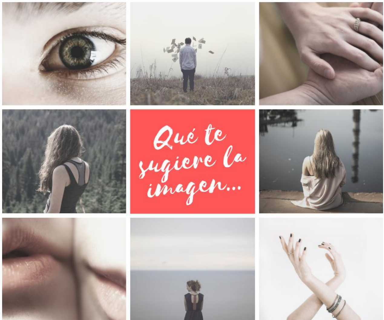
FIGURA 5. ELABORADA CON EL PROGRAMA CANVA