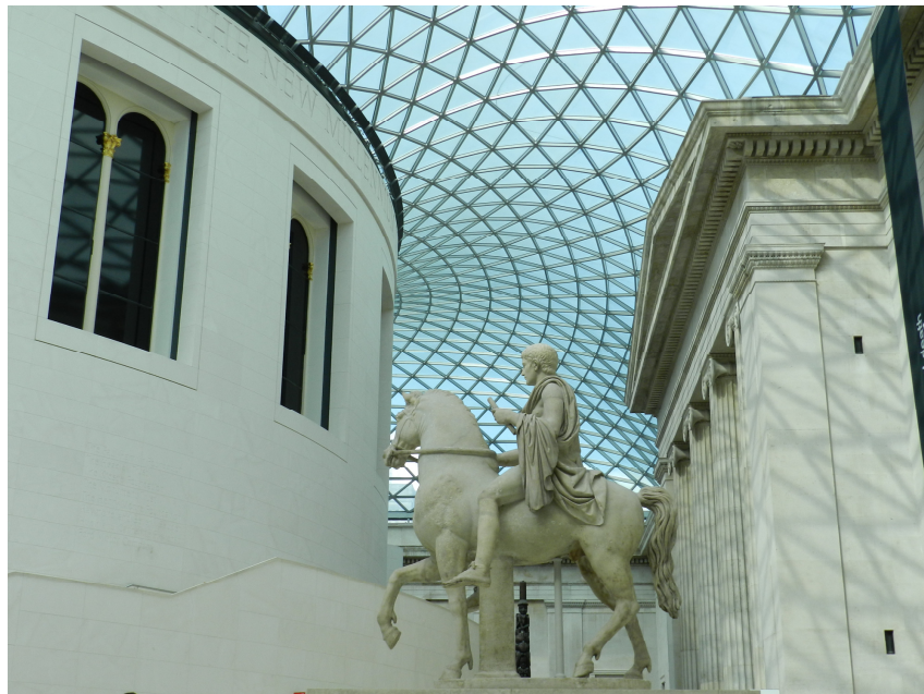
Fig. 4 Museo Británico