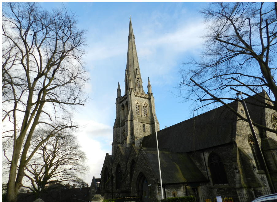
Fig. 3 Iglesia Anglicana Christ Church en Hampstead – Londres