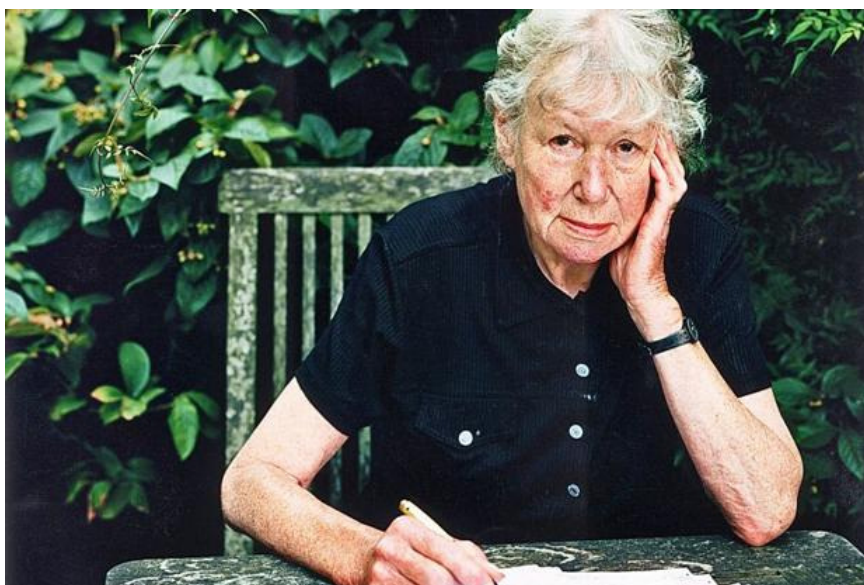
Fig. 1 Penelope Fitzgerald 1