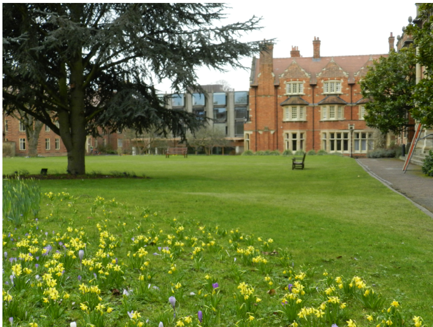
Fig. 5 Jardín interior de Somerville College, Oxford