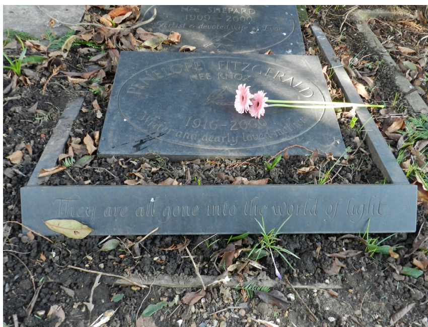
Fig. 6 Tumba de Penelope Fitzgerald en Hampstead-Londres