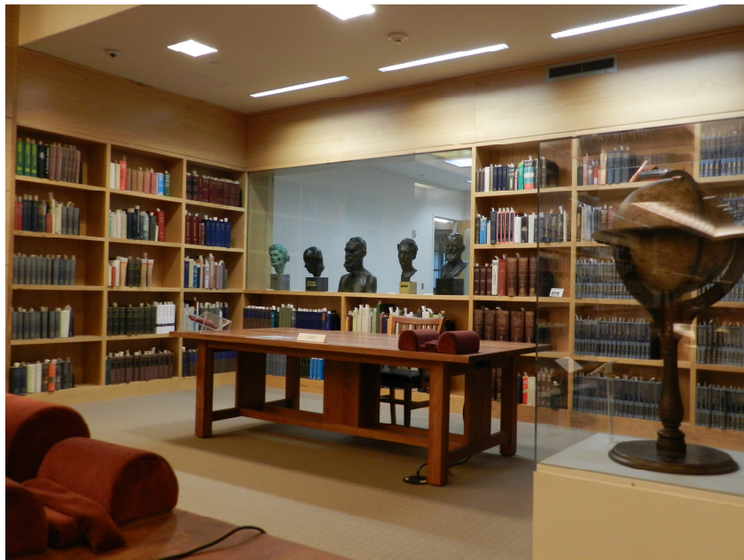
Fig. 7 Harry Ransom Centre - Universidad de Texas