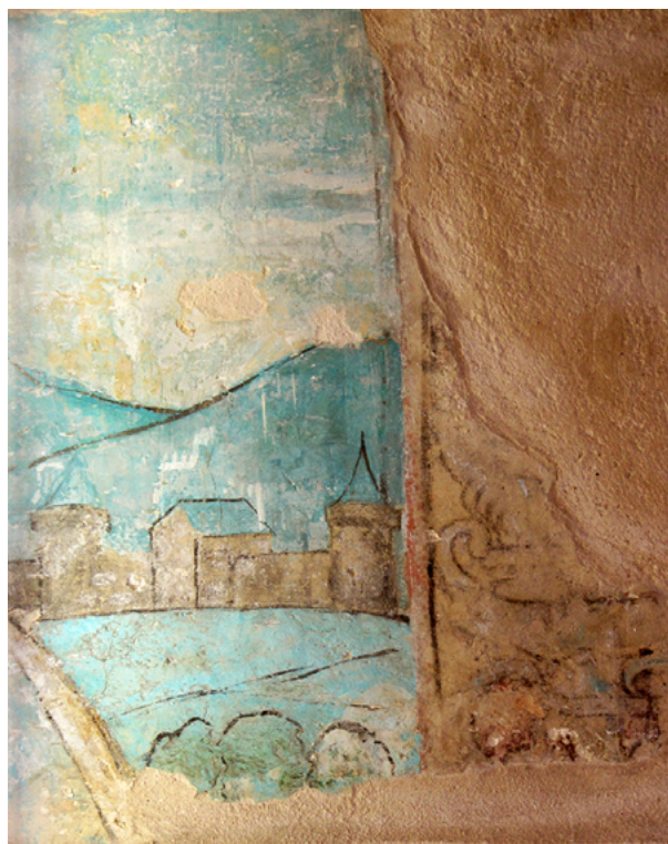
Fig. 2. Anónimo, Vista de ciudad ¿Sanlúcar de Barrameda? Fines del siglo xv, parroquia mayor de Ntra. Sra. de la O, Sanlúcar de Barrameda.

No extraña que el que fuera cronista de la casa incluyera en una obra general de la historia de España diversos hechos referentes a la familia ducal, como su título nobiliario en el cap. xxiii (fol. xx), la gesta del fundador en el cap. xxxii (fol. xxxvii) o el desastre de don Enrique en las aguas de Gibraltar en el cap. xxx (fol. xxxv vto.). Y, lo que nos interesa, una pequeña historia de la propia Sanlúcar, que tan bien conocía, pues estuvo, según sus palabras, cincuenta años al servicio de los Guzmanes, y en su casa se crió y vivió como sus padres, declarándose «su antiguo criado y fiel servidor», como demuestra el haber sido el maestro del joven vii duque. En los folios que dedica a la «Provincia del Andalucía», reserva el cap. xli a «la villa de Sant Lucar» (fol. xlvi r y vto. y xlvi r). Recoge su pasado tartésico, la existencia de un santuario fenicio y el origen filológico del nombre, sintetizando lo esencial de la población, ser capital del Estado de los Guzmanes y su carácter comercial cosmopolita, como puerto y puerta de América. Dirá: