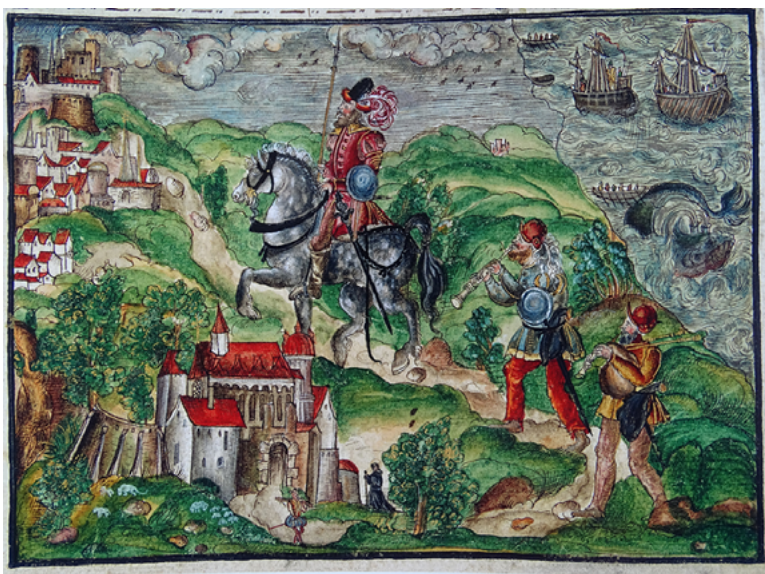
Fig. 5. Jerome Coeler, Núremberg (1560 y 1632) (Coeler al. Köler, The British Library de Londres), en Rubiales Torrejón, J. (coord). El Río Guadalquivir. Del mar a la marisma , p. 131.

Una nueva recreación visual de la ciudad la encontramos en un grabado alemán de Jerome Coeler, publicado en Núremberg entre 1560 y 1632 (Coeler al. Köler, The British Library de Londres), que representa a un capitán y a dos de sus hombres que se dirigen a caballo y a pie, respectivamente, para embarcarse en una de las naves allí fondeadas, camino de Venezuela, entrando a Sanlúcar por un camino paralelo al Guadalquivir, posiblemente desde Sevilla. El contexto es claro, pues se representa la desembocadura del río en el margen superior derecho, con dos naos y varias barcas de transporte a remos, posible referencia a la expedición, y el camino terrestre que se corresponde a la realidad que aún subsiste. Sin embargo, la interpretación de la ciudad y de sus edificios es una recreación idealizada, deformada bajo el prisma del estilo artístico gótico alemán del grabador, aunque resulta exacta su disposición topográfica. A su izquierda deja un poderoso monasterio, que identificamos no sólo por la estructura del inmueble, sino por un fraile que se le acerca, como el desaparecido de San Jerónimo que se levantaba extramuros en esa zona. Más adelante el caserío, que mira hacia la costa, con varios edificios notables, con una iglesia provista de un aguzado chapitel gótico centroeuropeo, imposible para el estilo del lugar. Culmina la visión urbana una poderosa fortificación en alto, que se corresponde con el castillo de Santiago en la cresta de la barranca (Gil y Varela 2011) (fig. 5).