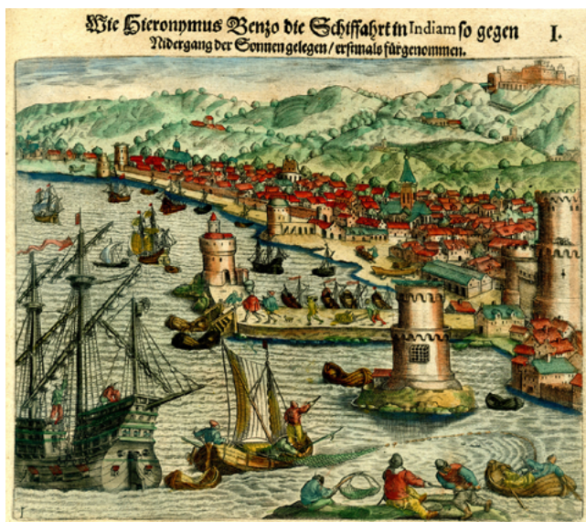
Fig. 4. Girolamo Benzoni, Dell'Historie del Mondo Nuovo ; grab. de Theodor De Bry, 1594, det. col. particular.