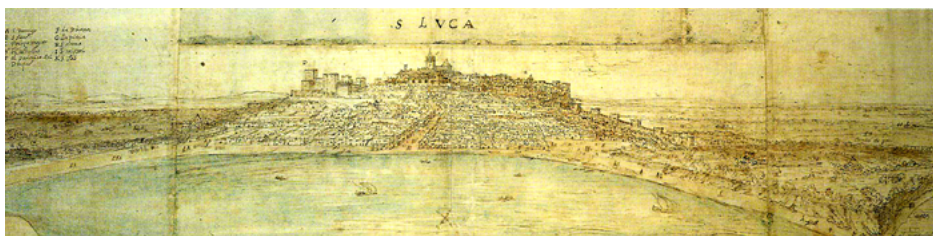
Fig. 6. Anton Van den Wyngaerde, Vista de Sanlúcar de Barrameda , 1567 (Ashmolean Museum de Oxford C.III 259).

Es de suponer que el apoyo económico, que permitió al pintor viajar por buena parte de Andalucía, se reflejó en la ejecución de los apuntes y dibujos fechados en 1567. Y como no podía ser menos, varias de las «vistas» recogen ciudades y lugares pertenecientes o vinculados a la casa ducal, esenciales en su poder económico y simbólico, Tarifa, Zahara de los Atunes y Sanlúcar de Barrameda. El documento contable aclara que parte de las mismas no se habían realizado, al emplear la expresión «que a de pintar», entrando en el lote todas o partes de las fechadas ese año. O cómo el artista se encontraba en Sanlúcar, pues se anota la carta de pago, lo que permite fechar con exactitud en abril el entorno de la «vista» sanluqueña.