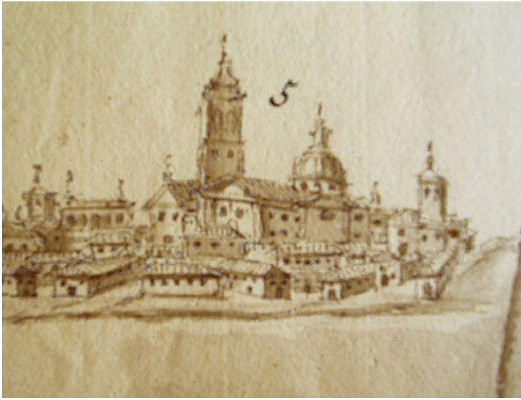
Fig. 8. Francisco Díaz Pinto, mapa topográfico del Coto de Doñana, detalle de Sanlúcar de Barrameda, 1789, cortesía de la Fundación Casa Medina Sidonia.

ese lado, otra obra vandevalviriana, el santuario de Ntra. Sra. de la Caridad, marcado por su torre. A la izquierda de la parroquial se aprecia el palacio ducal, con una danza de cinco arcos, y el castillo de Santiago, con la torre del homenaje, y algún otro edificio religioso, que se advierte por el campanario. Por debajo se desparrama el caserío, con algunas calles, como la central cuesta de Belén, que comunicaba la ciudad antigua con el arrabal comercial y mariner. Cierra la imagen con las dunas de arena de la playa 4 (fig. 8).