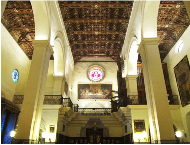
Fig. 1. Parroquia mayor de Ntra. Sra. de la O, Sanlúcar de Barrameda.