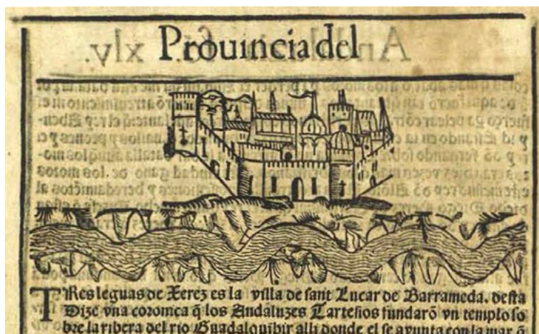
Fig. 3. Pedro de Medina, Libro de las Grandezas y cosas memorables de España , 1543, encabezamiento del fol. XLV v.

todas / naciones que vienen por la mar con sus mercaderías. Cerca desta villa es el puerto y estala de los navíos assí de los forasteros como de todas las naos que / van a Indias aquí acaban de cargar, y de aquí salen a todos los viajes pa / ra qualquier parte de Indias que vayan... (Medina 1549).