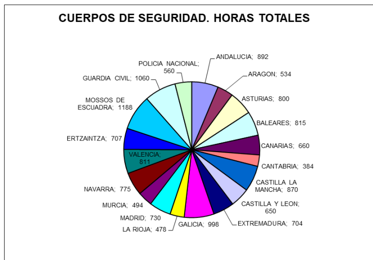
Gráfico 1. Horas totales de formación en los centros policiales de formación