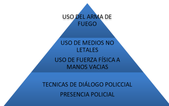
Gráfico 3. Pirámide gradual del uso policial de la fuerza.

El uso de la fuerza por parte de los agentes policiales está especialmente regulado, pues nuestro ordenamiento jurídico establece unos principios rectores a los cuales se ha aludido anteriormente. Estos principios están implementados en un sistema gradual en el curso de las actuaciones policiales, lo que quiere decir que a cada tipo de agresión debe darse una respuesta proporcional y oportuna acorde a las circunstancias de cada intervención y al bien jurídico protegido. Este sistema gradual puede representarse mediante la siguiente pirámide de opciones de respuesta de un agente de la autoridad.