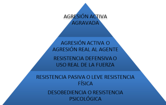
Gráfico 4. Pirámide inversa del uso policial de la fuerza.

concretos que puede utilizar ante las diferentes agresiones durante la operativa policial, pero para poder ejercerlos eficazmente se debe conocer ante qué situaciones específicas deben ser esgrimidos. Aunque se haya hablado anteriormente del concepto de agresión, y en especial de las infracciones penales, el ordenamiento jurídico no nos dice en que momentos concretos y ante qué situaciones concretas esas conductas son merecedoras de una respuesta profesional por parte del agente de policía, y por ello es necesario recurrir a la pirámide invertida del uso policial de la fuerza que también nos relata RODRÍGUEZ COQUE 223 .