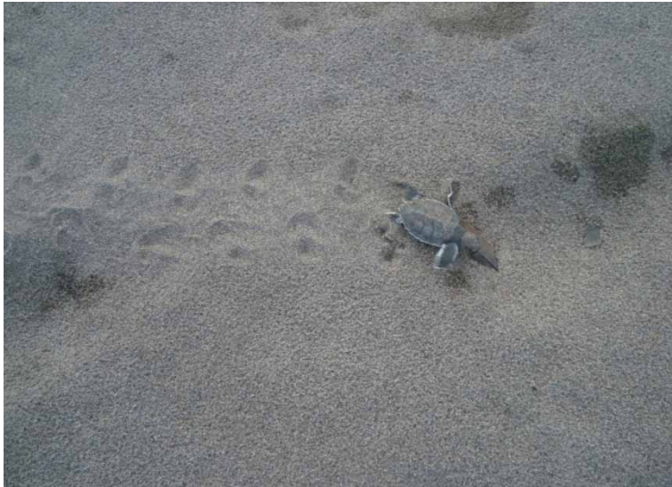
Autoria: Monica Araújo (2013)

Um dado por demais interessante, e isso parece ser endêmico, segundo Georgina Zamora 6 e os pesquisadores Arroyo-Arce; Guilder; Salom-Pérez (2014), diz respeito à cadeia alimentar daquele ecossistema, entre os elos jaguar ( Panthera onca ) e tartaruga verde ( Chelony mydas ). Originalmente solitários, mudaram seus hábitos e tornaram-se comunitários, menos competitivos entre si, devido à abundância desses quelônios no seu habitat, inclusive o declínio de suas presas primárias devido à caça ilegal no parque e em seu entorno.