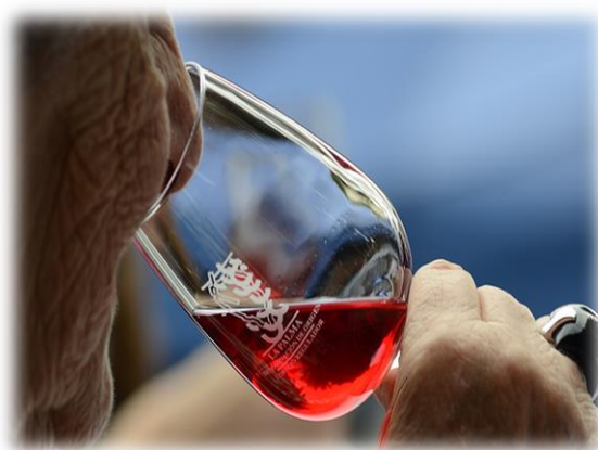
Ilustración 7 Enología, Denominación de Origen, La Palma

Concluye aquí una ruta especial, diferente, en la que el turismo astronómico y enológico ha pasado a ser una fuente de experiencias únicas en una isla diferente y con unos recursos naturales muy atractivos para cualquier visitante del mundo.