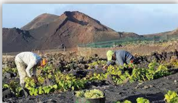
Ilustración 5 Cultivo de la viña

Todas y cada una de las diferentes variedades de vino que se cosechan en la isla conforman una oferta de enoturismo amplia, diversificada y con mucho potencial de futuro. A esto le sumaremos que son productos locales, de kilómetro 0, cuestión que atrae mucho a cualquier consumidor con interés en descubrir los productos de la isla.