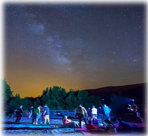
Ilustración 6 Astroturismo, Antonio González