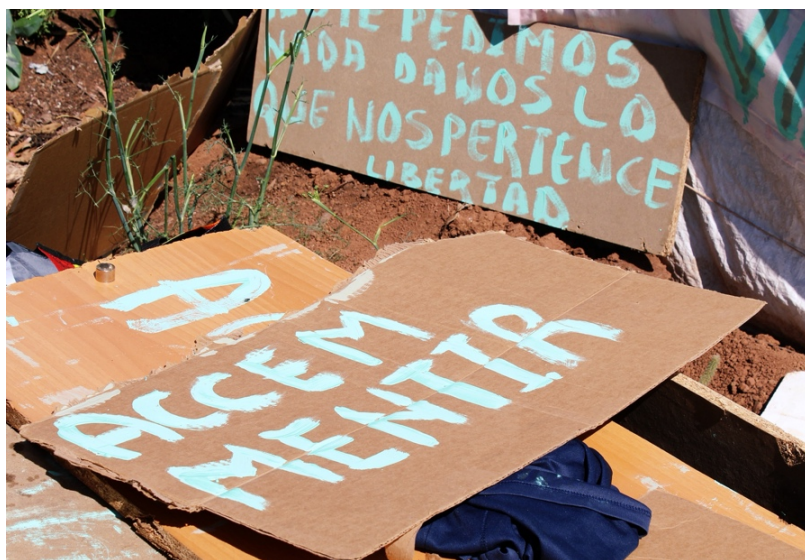
Carteles realizados por migrantes participantes en una protesta contra la organización.

Testifica que concibió cómo los migrantes no ven salidas y se les agota psicológicamente tanto a ellos como al personal, por lo que los psicólogos no dan abasto. Relata, con lágrimas en los ojos: “Esta es la continuidad de la esclavitud disfrazada. Durante toda la historia de la humanidad hemos explotado África y América, y retenemos a los mismos que han tenido que pagar las consecuencias. No quiero formar parte de este tipo de sociedad, me da vergüenza formar parte de esta raza humana. No se está respetando su viaje y su camino, no estamos escuchando sus historias. Hay dos caminos: el que sirve la luz para la luz y el que sirve la oscuridad”.