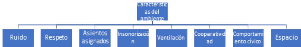
Figura 2: Diagrama “características del ambiente”. Elaboración propia.

En el siguiente diagrama se pueden observar las categorías identificadas en la unidad de análisis “Características del ambiente”.