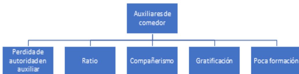
Figura 1: Diagrama “Auxiliares de comedor”. Elaboración propia.

En el siguiente diagrama se pueden observar las categorías identificadas en la unidad de análisis “Auxiliares de comedor” y se comentan a continuación.