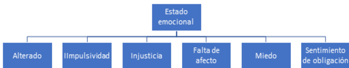
Figura 5: Diagrama “estado emocional”. Elaboración propia.

En el siguiente diagrama se pueden observar las categorías identificadas en la unidad de análisis “Estado emocional”