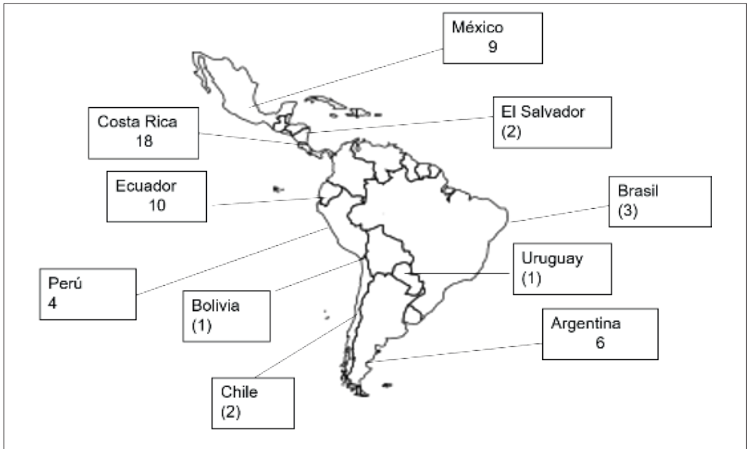
Imagen 2: Casos de éxito de Turismo Comunitario en América Latina