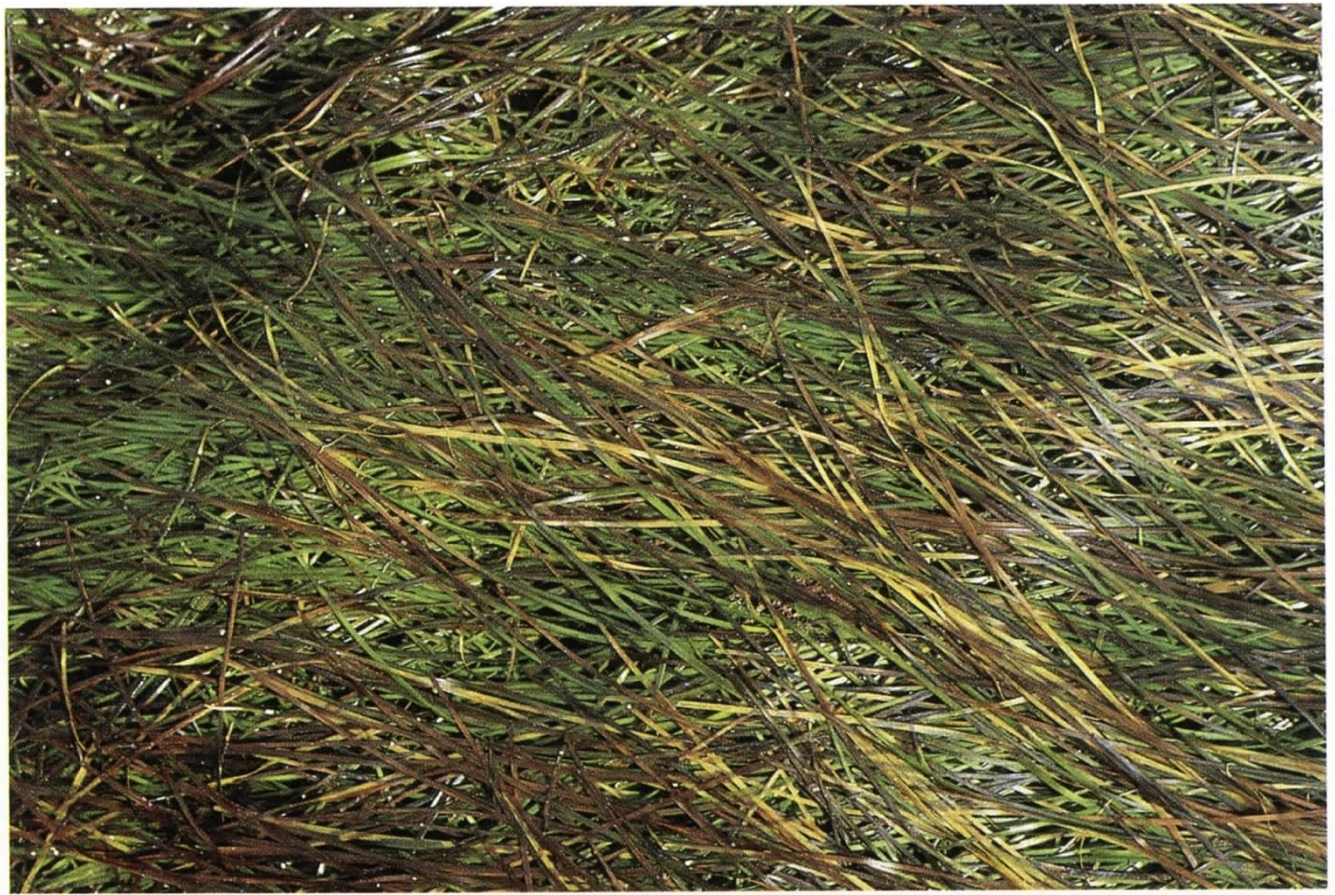
FIGS. 2-3.- Diferentes aspectos de las praderas de Zostera noltii parcialmente emergidas durante la bajamar.