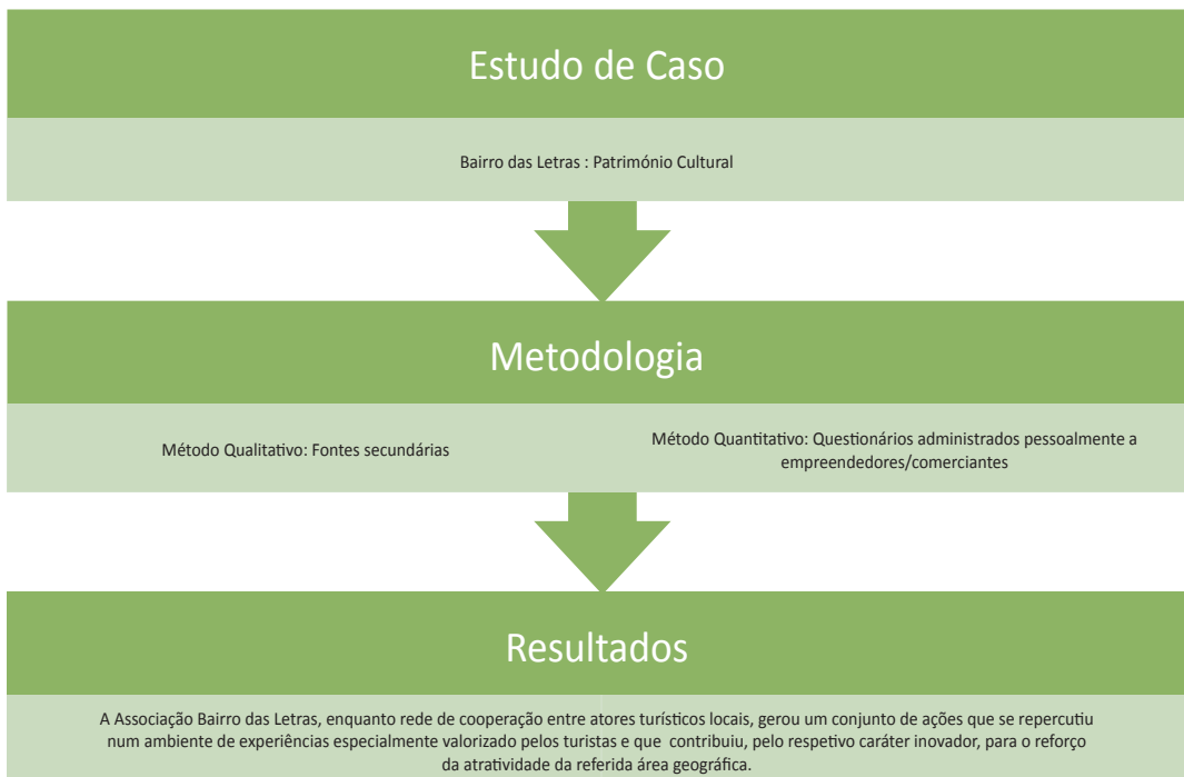
Figura 3: Estudo de Caso 2

As novas tendências da indústria do turismo têm propiciado o aparecimento e o crescimento da oferta de turismo urbano de experiências a que os chamados “bairros” dão resposta e de que o Bairro das Letras em Madrid, é exemplo (Henche & Carrera, 2017). O Bairro das Letras situa-se no centro de Madrid, constitui o cenário de maior concentração de talento da história da literatura universal e aí podem encontrar-se alguns dos recursos patrimoniais de destaque da capital, inclusive o Museu Nacional do Prado. A oferta cultural, comercial e de “ócio” do Bairro das Letras assenta numa adaptação e remodelação de uma zona histórica, capaz de proporcionar novas experiências aos turistas com novas necessidades e para o que muito contribuiu o associacionismo e as redes de colaboração do pequeno comércio e empreendedores do local, junto com instituições culturais que com eles se relacionam. A Associação de Comerciantes do Bairro das Letras, em particular, agrega empreendedores e comerciantes localizados na área, com capacidade de coordenação e agilidade necessárias para a dinamização de um conjunto de iniciativas e atividades, com um timbre único e diferenciador, evidenciando, dessa forma, um considerável nível de inter-relação e colaboração entre si.