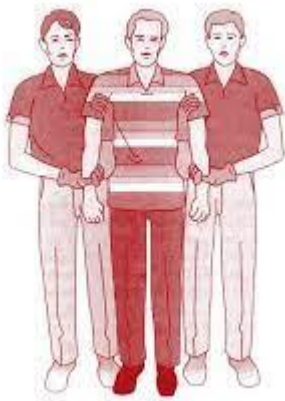
Figura 2: Demostración del personal acompañando a paciente agitado a la habitación, sujetándolo por debajo de las axilas y por las muñecas (16)

A) Si es un paciente colaborador y su estado lo permita, si él lo desea puede ir a pie; para acompañarle hasta la habitación, pueden ser suficiente dos personas que le sujeten por las axilas empujando hacia arriba, y por la muñeca, tirando hacia abajo. Esta maniobra se llevará a cabo lo suficientemente firme para dar seguridad al procedimiento, pero sin llevarla a lo extremo para no lesionar al paciente (Figura 2).(16)