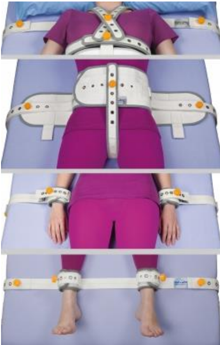
Figura 1: Material completo formado por 9 correas y 15 botones de cierre magnético de la marca SALVAFIX. (15)

La vivencia de la sujeción mecánica experimentada por el personal sanitario de la Unidad de Salud Mental del Hospital General de La Palma.