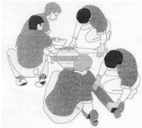
Figura 3; Demostración de los miembros del equipo sanitario en la reducción de un paciente agitado que no colabora (16)