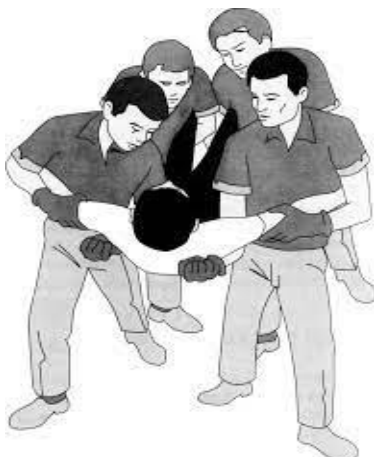
Figura 4; Demostración del equipo de sanitarios trasladando a paciente agitado que no colabora a la habitación (16)