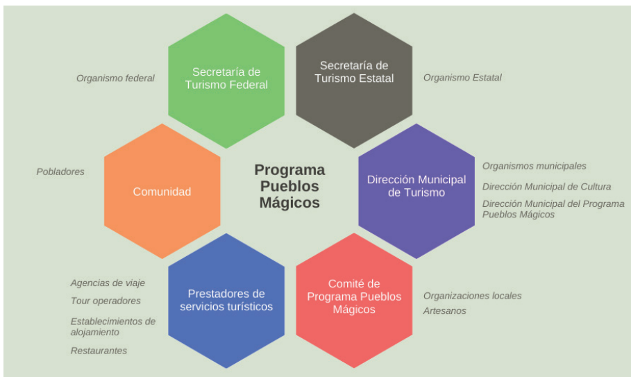
Ilustración 1: Nivel organizativo en PPM

De esta forma, los actores del PPM se pueden identificar desde un enfoque normativo e instrumental. Para el normativo, se retoma el análisis de las partes interesadas en la implementación y gestión del programa; de estos actores destaca el empoderamiento en los procesos de toma de decisiones; por ello se toma en cuenta las dependencias e instituciones federales, estatales y municipales que forman parte de la administración del programa. En segundo lugar, del enfoque instrumental, se retoman la gestión estratégica y el desempeño de los actores en contacto con el visitante; éste engloba a los prestadores de servicios turísticos, comerciantes y habitantes de la localidad. (Ilustración 1).