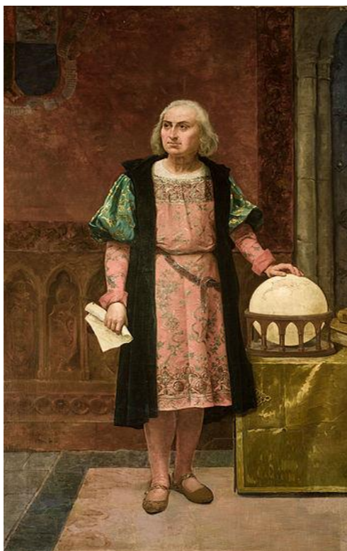
Imagen: Cristóbal Colón (Wikimedia Commons)

Según la descripción realizada por el propio Colón, estas islas configuraban la puerta de entrada occidental a las Indias.