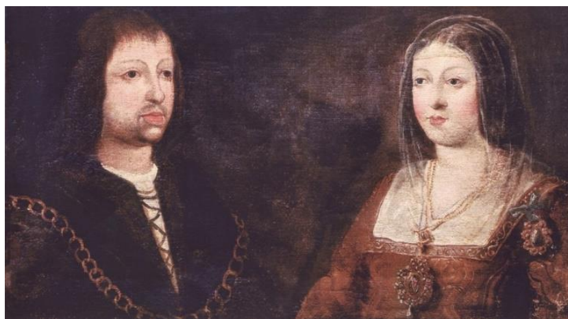
Imagen: Los Reyes Católicos