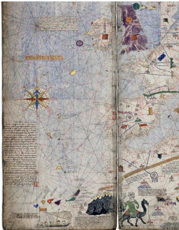
Imagen: Las islas Canarias en una reproducción parcial del mapa de los Cresques (s. XIV) (Wikimedia Commons)

1) Tingitana (Mauretania Tingitana = antigua provincia romana noroccidental de África) pertenece a Castilla y León; ahora bien, las Canarias son islas de Tingitana, luego son parte de Castilla [...] , 2) el rey Enrique hizo ocupar [...] la isla de Lanzarote con intención de recuperar todas [...]; la consecuencia no puede ser más que una: las islas Canarias son del rey de Castilla y León, y nadie puede ocuparlas sin expresa licencia o benigna tolerancia del rey [...] 33 .