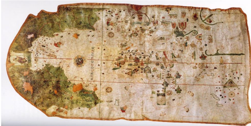
Imagen: mapa de Juan de la Cosa (1500)