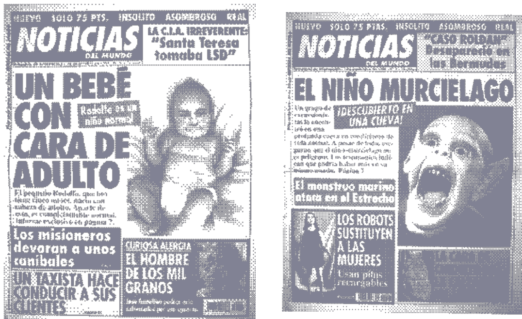
Portada de Noticias del Mundo, 1994-95

En este apartado se impartirá el origen de las noticias falsas antes incluso del surgimiento de Internet. El alumnado debe conocer que no se trata de un fenómeno novedoso, si bien, los nuevos canales de comunicación social están facilitando la viralidad de este contenido. Hace años, ya encontrábamos incluso periódicos editados que incluían noticias falsas adornadas con titulares sensacionalistas para provocar el asombro y que generaban un efecto llamada entre la sección más crédula de la sociedad.