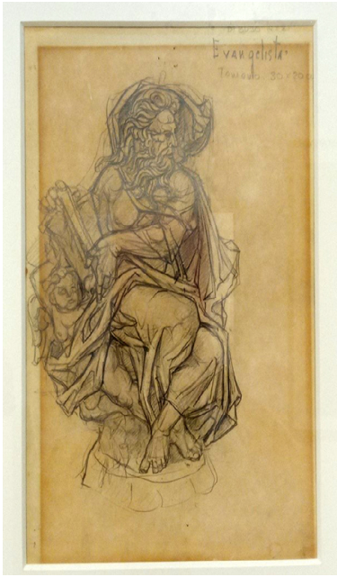
Fig. 8. Luis Ortega Brú, Evangelista Mateo , 1979. Lápiz sobre papel. Museo Municipal de San Roque.