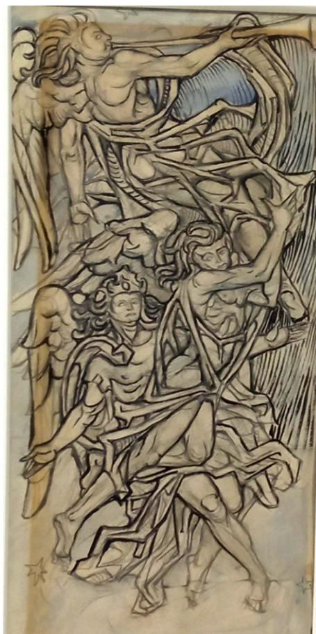
Fig. 5. Rompimiento de Gloria II , 1979. Tinta sobre papel. Museo Municipal de San Roque.