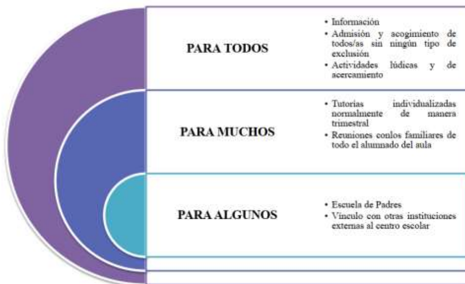
Figura 2. Acciones para elaborar un PAF. Elaboración propia basada en Orientación Familiar: Padres y Maestros (2010).

En el gráfico anterior muestra de forma esquematizada cuáles son las acciones que van a llevarse a cabo desde el órgano del centro para los familiares del alumnado.