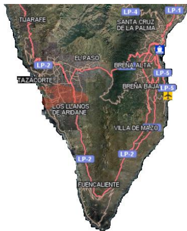
Figura 2. Límite de la colada del volcán Cumbre Vieja, La Palma