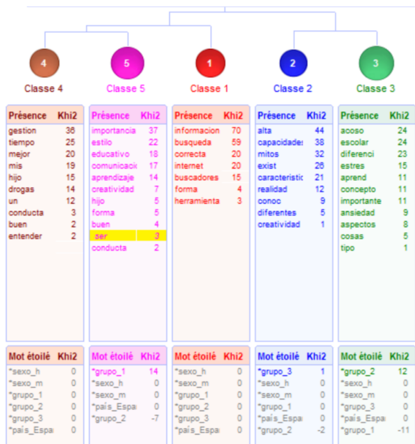
Dendrograma pregunta 1: Aprendizajes

En la tabla 6 se plantea la información de las cinco clases, las cuales hacen referencia a los cinco temas que más han aprendido los participantes del programa. Dichas categorías han sido denominadas como: búsqueda de información , altas capacidades , acoso escolar , gestión del tiempo y estilo educativo . Asimismo, se presenta la unidad de contexto elemental (UCE) de cada una de ellas, el porcentaje del corpus del texto que representa y la palabra con mayor frecuencia de aparición.