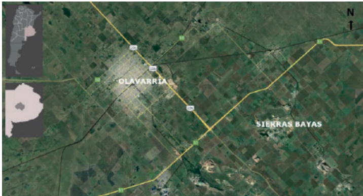
Figura 1: Mapa de ubicación de la localidad de Sierras Bayas.

vez, para la conformación de la red se establecieron contactos y averiguaciones acerca de la existencia de convenios y llamados a convocatorias que permitiesen solicitar subsidios para la obtención de dinero.