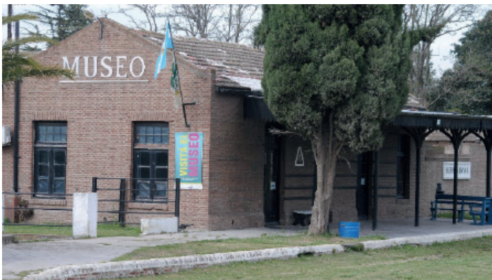
Figura 2: Vista del Museo y Archivo Histórico de Sierras Bayas o Museo de la Estación (MESBA)