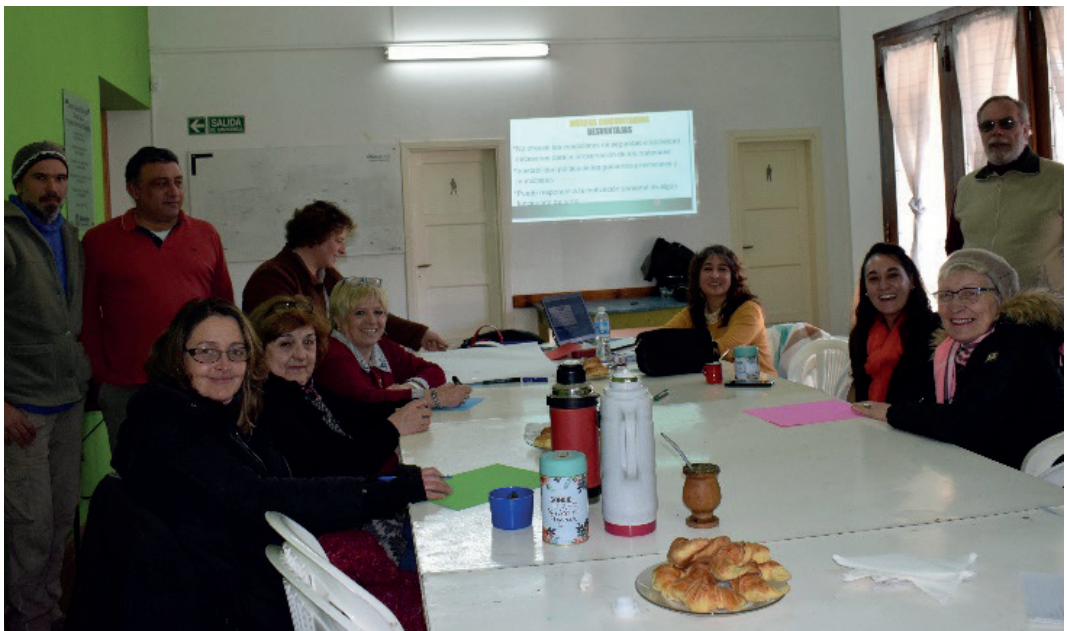
Figura 5: Segundo taller 12 de julio de 2019, en la foto los integrantes de Amigos del Museo, funcionaria municipal, empleada administrativa, colaboradora y autora.

La última instancia de trabajo incluía la realización de talleres abiertos a la comunidad (herramienta implicativa) con el propósito de elaborar de manera colaborativa el diseño de una exhibición permanente para el MESBA. En ellos participaron los principales grupos de interés y solo al primer taller se acercaron habitantes de la localidad invitados a través de las encuestas. Se tomaron una serie de decisiones y acuerdos, y se realizaron las siguientes actividades (Figura 5): 1) se compartieron los resultados de las encuestas para conocer las opiniones de habitantes de la localidad, considerándolos potenciales interesados a participar en el armado de la exhibición. 2) se consensuó que la prioridad era realizar las refacciones edilicias (arreglos del techado, paredes y pisos) y posteriormente, crear la exhibición permanente, lo que implicaba, la postergación de esa tarea en el plan original. 3) se acordó diseñar y filmar un video documental de festejo de los 25 años de la institución (en octubre de ese año), con el propósito que incluyera la historia de la misma y de sus colecciones, y difundir este proyecto de trabajo colaborativo (Chaparro, 2019). Por último, se trabajó como estaba pautado inicialmente, en definir los temas que la futura exhibición permanente debía relatar y utilizar esa información como insumo para el guion del audiovisual, de esta manera el mismo también fue realizado de forma conjunta (Figuras 6 y 7).