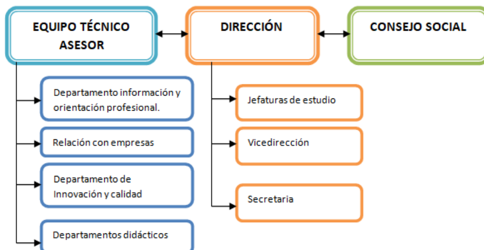
Figura 1: Organigrama del CIFP Los Gladiolos