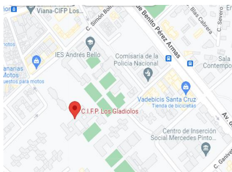
Ilustración 1: Ubicación CIFP Los Gladiolos