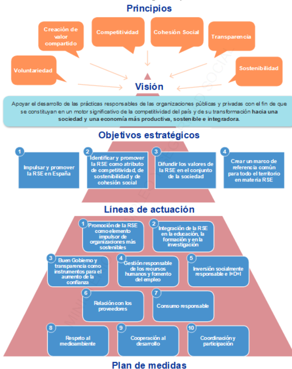
Gráfico 1 – Estructura de la Estrategia Española de RSE de las empresas.