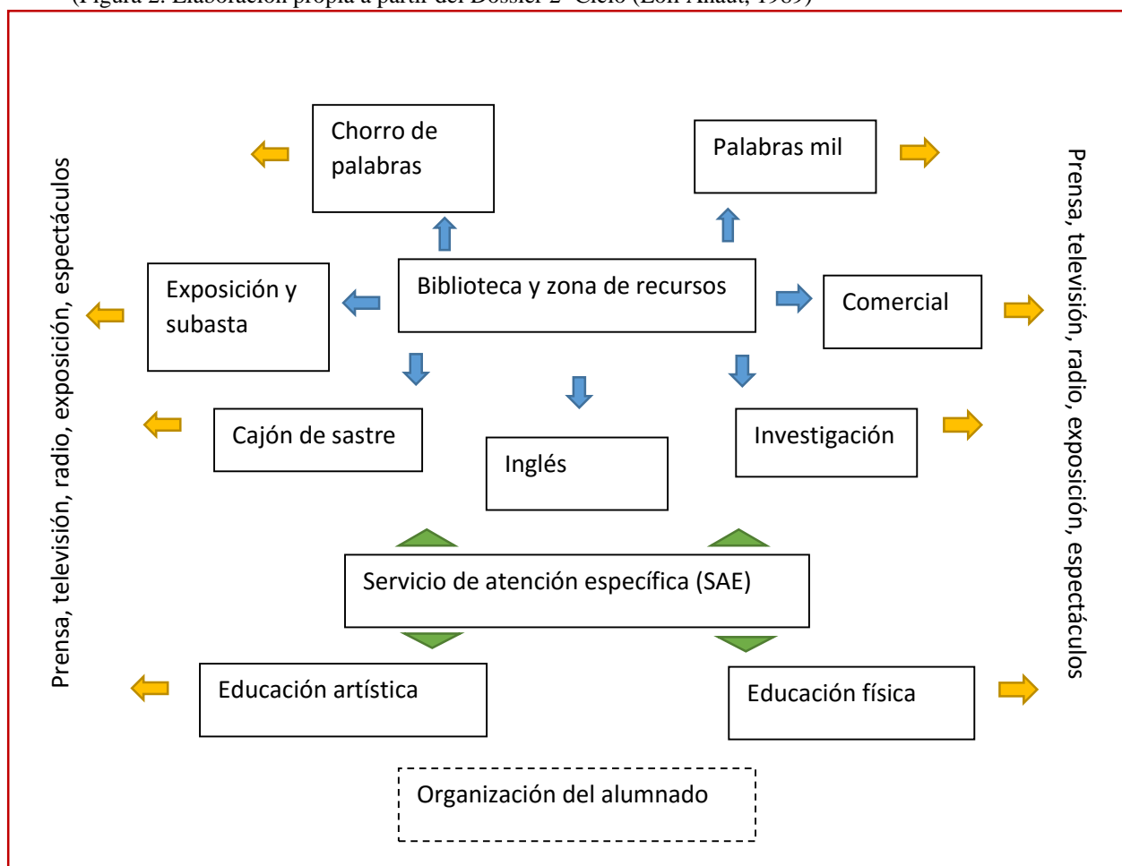
(Figura 2. Elaboración propia a partir del Dossier 2º Ciclo (Loli Anaut, 1989))

Los alumnos van rotando por las aulas según la materia que aparezca en el horario diariamente. Dentro de cada aula se observan rincones, normalmente cuatro, con diferentes actividades que se realizan con ayuda de la mediateca/biblioteca donde pueden utilizar sus recursos didácticos. Las actividades de cada aula tienen su fin, su salida exterior a través de la prensa, la radio, la televisión, la exposición, el espectáculo, o páginas web, cuyo funcionamiento se llevan a cabo gracias a los alumnos del tercer ciclo. El profesor tiene el papel de acompañar al alumnado en su aprendizaje dotando de contenido los distintos contextos y realizando las intervenciones necesarias como guía y observador del proceso educativo; ayudando al alumno a construir su propio aprendizaje así como el seguimiento y la evaluación de sus avances.