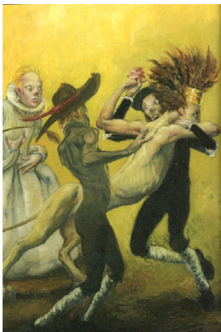
Fig. 2. Gabriel Gr n, La vida es sue o , 2018, 18,5 x 27,2 cm. Fuente: editorial Zorro Rojo, Barcelona, p. 70.

un discurso de lo intangible y de lo que no se puede codificar (la apor a, lo monstruoso)... (Marshall 2003, 202).