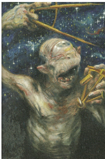
Fig. 1. Gabriel Grün, La vida es sueño , 2018, 18,5 × 27,2 cm.

Segismundo se debate entre dos escenarios ocupados por su mismo ser, humano en su rasgo dual y contradictorio. Grün trabaja esa dualidad humano-bestia mediante trazos leoninos: rey de la selva de las pasiones indomables es aquel Segismundo que con ira reproduce el texto que justifica los excesos de su padre. Por otro lado, el príncipe enteramente humano es aquel que desde el cautiverio ejercita aquello que lo diferencia de las bestias: la reflexión, la imaginación, el pensamiento... (Evelson 2018).