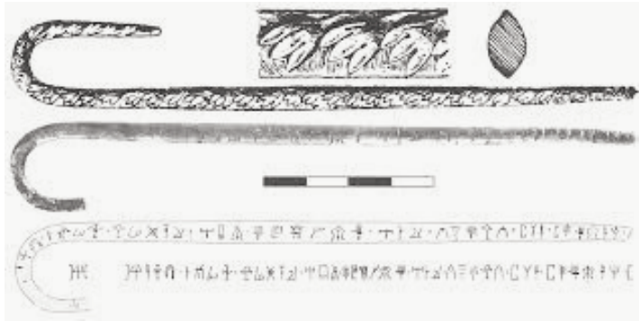
Αργυρή ενεπίγραφη περόνη από το Μαυρόσπηλιο (Verduci - Davis, 2015).

Μεσαράς (Xanthoudides, 1924: 109-110, Alexiou - Brice, 1976: 20, Verduci - Davis, 2015: 55-56). Η επιγραφή της περόνης από τις Αρχάνες συνίσταται σε εννέα (9) μόλις σημεία, αποτελώντας το συντομότερο, μέχρι στιγμής, κείμενο σε ενεπίγραφο κόσμημα (Verduci - Davis, 2015: 55) ενώ στην περόνη από τον Πλάτανο διατηρούνται είκοσι τρία (23) σημεία (Verduci - Davis, 2015: 57).