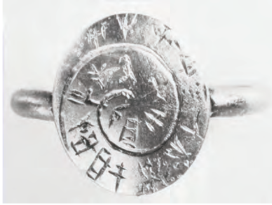
Χρυσό δακτυλίδι από το Μαυρόσπηλιο, GORILA KN Zf 13 , p. 152. https://thingsthattalk.net/nl/t/ttt:TQfYGq/m/directionality-and-readability .

Το πιο χαρακτηριστικό κόσμημα της συγκεκριμένης κατηγορίας είναι το χρυσό δακτυλίδι με μικρό συμπαγή κρύο και ωσειδή συμπαγή σφενδόνη, με επιγραφή Γραμμικής Γραφής Α, από τον θαλαμοειδή Τάφο ΙΧ στο Μαυρόσπηλιο Κνωσού (Forsdyke, 1926-1927: 264-269, Godart - Olivier, 1982: 152-153, Platon - Pini, 1984: no 38, Verduci - Davis, 2015: 53-54). 2 Προφανώς, αποτελούσε κτέρισμα κάποιου ΜΜ ΙΙΙ-ΥΜ Ι ταφής που είχε πραγματοποιηθεί στον Θάλαμο Ε του συγκεκριμένου ταφικού μνημείου (Μπάνου, 2000: 189). Η σπειροειδής, από την περιφέρεια προς το κέντρο, επιγραφή του συνίσταται σε δεκαεννέα (19) συλλαβογράμματα, δίχως διαχωριστικά κάθετα γραμμίδια ανάμεσα στις λέξεις, γεγονός που οπωσδήποτε δεν οφείλεται στην αβλεψία του χαρακτήρα ή στο μικρό μέγεθος της σφενδόνης (Μπουλώτης, 1986: 13). Θεωρείται, μάλιστα, πιθανό ότι, τα διαχωριστικά σημεία παραλείφθηκαν σκόπιμα είτε για να δοθεί έμφαση στην επιγραφή, προσδίδοντας της ακόμη πιο σύνθετο χαρακτήρα, είτε επειδή η τοποθέτησή τους κρίθηκε περιττή, ειδικά στην περίπτωση μίας και μόνης μαγικής ρήσης με αποτροπαϊκό χαρακτήρα (Μπουλώτης, 1986: 13). Επιπλέον, τη φυλακτήρια λειτουργία και αποτροπαϊκή διάσταση του δακτυλιδιού υποδηλώνει το γεγονός ότι η επιγραφή του είναι αναγνώσιμη πάνω στη σφενδόνη αλλά όχι και στο αποτύπωμά της, πράγμα που σημαίνει ότι το κόσμημα δεν ήταν, πρωταρχικά τουλάχιστον, σφραγιστικό (Μπουλώτης, 1986: 13).