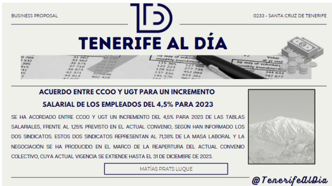
Figura 4. Titular para la sesión N°3.