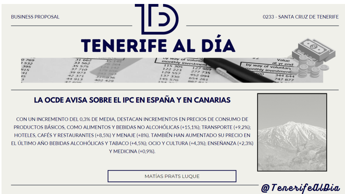
Figura 6. Titular para la sesión Nª5.