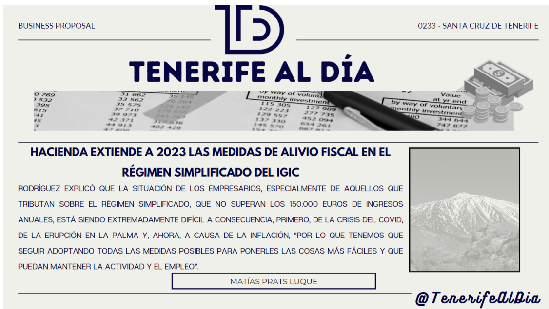
Figura 5. Titular para la sesión Nª4.