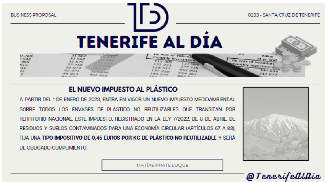
Figura 3. Titular para la sesión N°2.