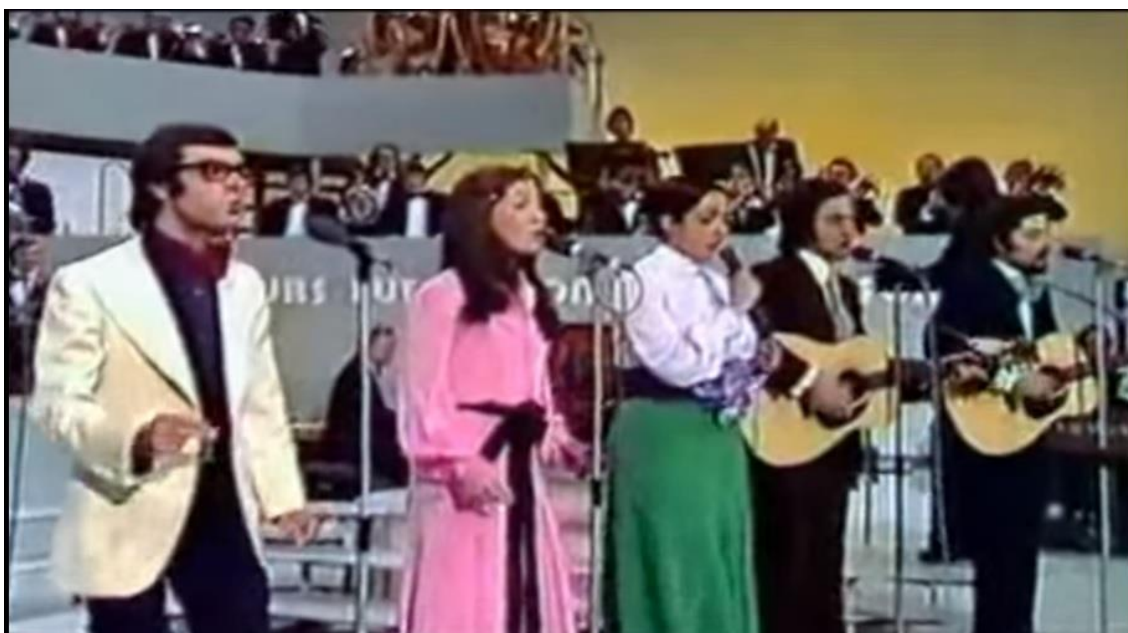
Imagen 9. Escenario de 1973, aparece Mocedades.