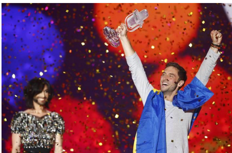
Imagen 3. Edición 2015, Måns Zelmerlow se corona ganador.

Un ejemplo sería Måns Zelmerlow, ganador de la edición de 2015, el cual presentó Eurovision Song Contest de 2016. Lo podremos ver a continuación, el momento en el que lo proclaman primer puesto y en el que aparece presentando: