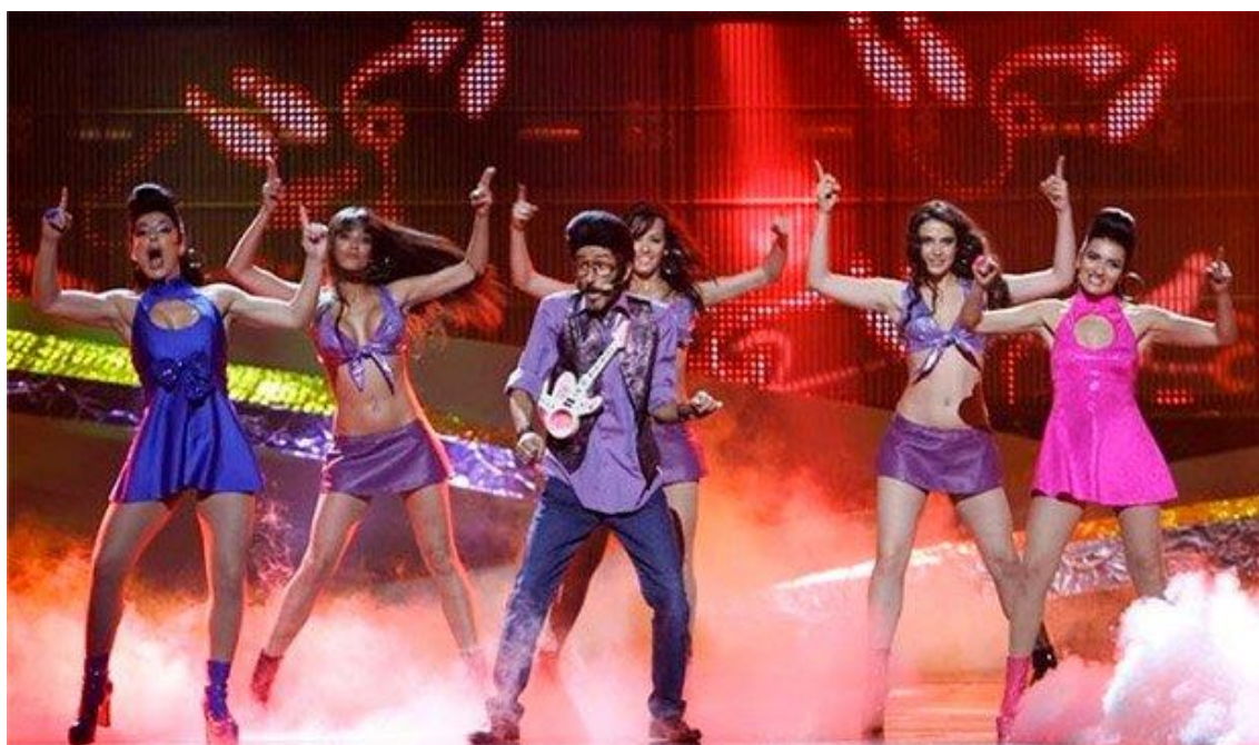
Imagen 14. Rodolfo Chikilicuatre en el escenario de

• Puntuación. Si la cantidad de países aumenta, también aumentará la cantidad de puntos en el marcador. Además, ahora hay muchas más televisiones y teléfonos (para efectuar el televoto) por casas, llegando algunas a tener más de una pantalla y por supuesto, más de un móvil. Algunas de las máximas puntuaciones de las primeras galas eran 31, 42, 26, etc. Hoy en día son 534, 365, 290, etc.