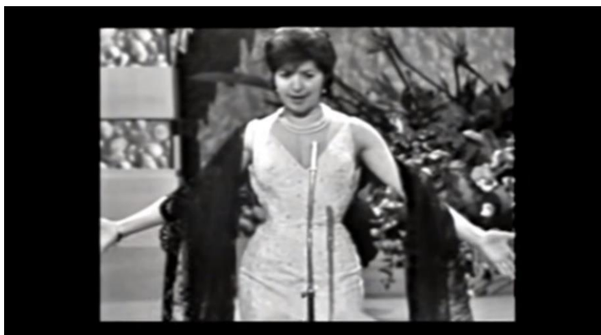
Imagen 16. Conchita Bautista en la edición de Eurovisión de 1961.

Es por ello, que con tan solo observar ambas ediciones puede descubrirse qué España se vivía en cada momento, en qué situación se encontraban o se encuentra cada artista y cómo se ha ido progresando para bien hacia un futuro más claro.