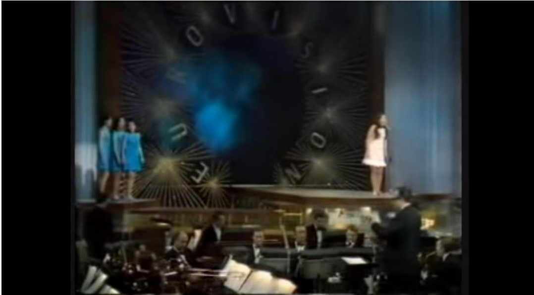
Imagen 7. Escenario de 1968, aparece Massiel.

el cual lució la cantante Salomé en su espectáculo. Como curiosidad, Ledesma añade que los dos collares que llevaba, pesaban un kilo cada uno.