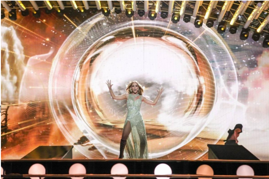
Imagen 17. Edurne en la edición de Eurovisión de 2015.