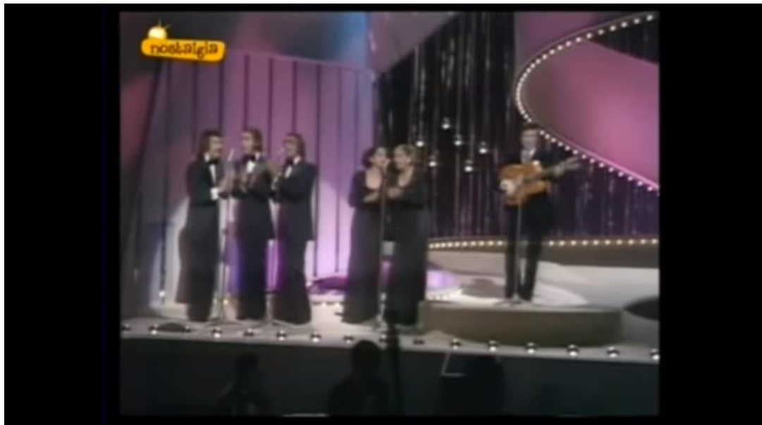
Imagen 12. Escenario de 1974, aparece Peret.