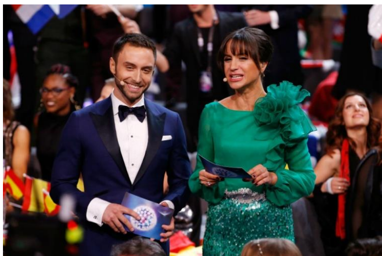
Imagen 4. Edición 2016, Måns Zelmerlow aparece como presentador.