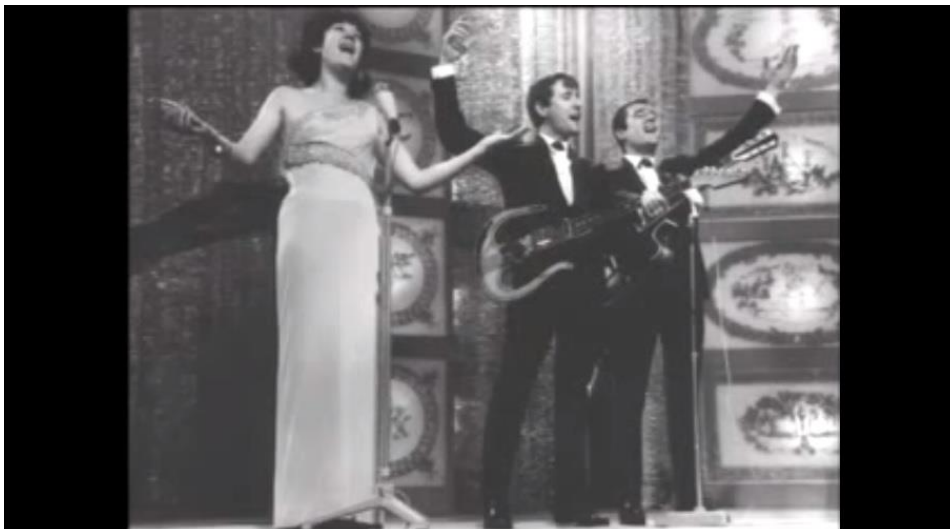
Imagen 13. Escenario de 1974, aparece TNT