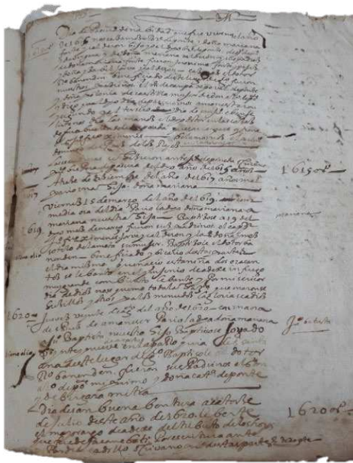
Figura 2. Protocolo 3