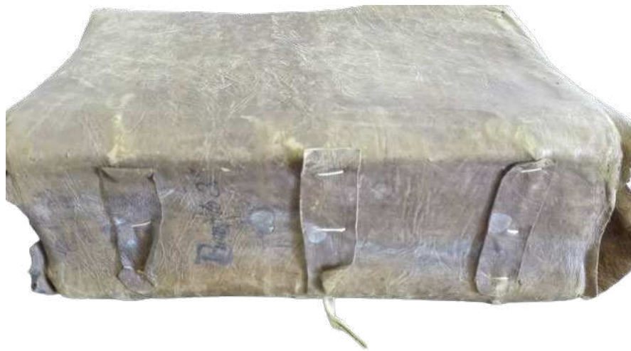
Figura 1. Libro de familia de Bartolomé de Ponte