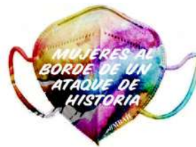
MUJERES AL BORDE