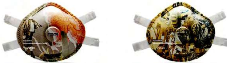
Fig. 5 y 6: FFP3-HANNAH HOCH, 2020. Zaida Hernández Romero y Mariana Hernández Curbelo.

El diseño ha sido realizado con el programa de edición de imágenes Sketchbook, disponible para Mac y Windows, en la que las imágenes se acoplan perfectamente a la superficie de la mascarilla. Se realiza una selección de la obra y se reproduce sólo una parte de ella, lo que se considera más significativo en cuanto a significado formal y estilístico.