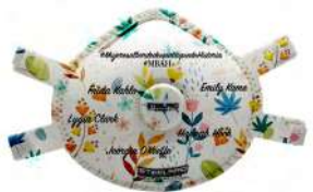
MUJERES AL BORDE