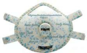
MUJERES AL BORDE