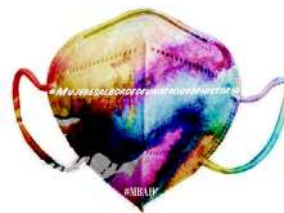
MUJERES AL BORDE