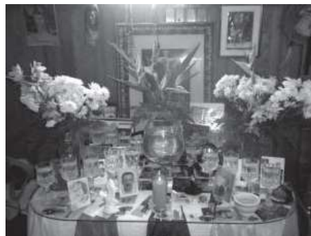
Fig.9. Altar espiritista en un local en La Guancha, Tenerife

Su mesa de trabajo está plagada de estampas de santos y vírgenes, una enorme escultura de Don José Gregorio médico, libros entre los que reconozco Prácticas y creencias de una santiguadora canaria y otros, junto a expedientes de pacientes que no solo acudirán a solicitar sus servicios de sanador, sino sus dotes de espiritista para lo cuál tiene una bóveda espiritual impactante y sus servicios como santero, para lo que posee un precioso canastillero donde los Orishas descansan a sus anchas en las soperas, las imágenes, las ofrendas y las velas ocupan todo el espacio. En una esquina de su despacho y junto a una camilla que comparte con sus hijos para variadas funciones tiene una repisa de madera que ocupa toda la pared hasta el techo. En su espacio de trabajo hay botes con yerbas, tanto autóctonas como foráneas, secas o frescas, pues las cultiva en su casa, semillas, conchas, clavos, metales, quemadores, herraduras, velas y piedras junto a botellas de anís dulce, miel, vino de cocina, ron Liberte, Red Label y otros líquidos sin etiquetar. Hay frascos con esencias de Yemayá, Oshun, Changó y otros Orishas y cajas con polvos de Oggún, de lava casa, de la mujer amada, del rey Midas, tierras de distintos lugares, tabaco, cascarilla, etc.