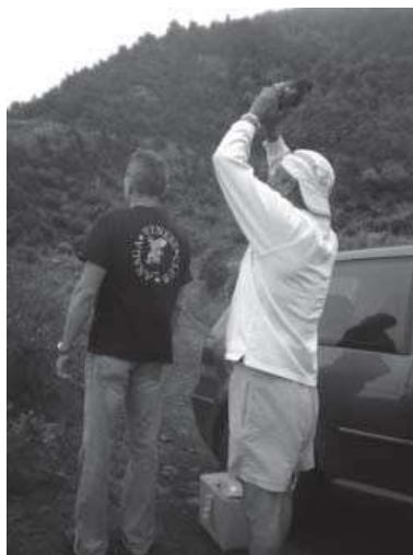
Fig..10. Ritual de sanación en el monte de Las Mercedes, Tenerife

con los llegados del continente americano, encontrando en la naturaleza aquello que ya les es familiar. Por ello cada vez resulta más importante el secreto geográfico de la localización de determinadas plantas, ahora fuente de poder y por tanto, muy controlado.