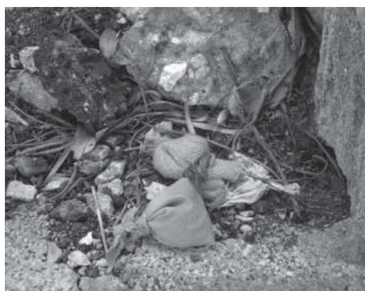
Fig..4. Trabajo de sanación en la calle, Vedado, La Habana, Cuba

en un objeto que entre en contacto directo como puede ser un animal vivo o muerto (perros, palomas). Pero la más temida, por incontrolable, es aquel que te llega sin contacto físico alguno, a modo de maldición o trabajo realizado por un religioso o del que todos estamos prevenidos: recoger un daño quitado a otro al tomar contacto con el objeto en el que ha sido depositado (clásico ejemplo de la paloma con el lacito rojo, terror de las aceras y madres cubanas).