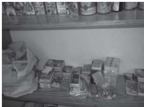
Fig.8. Espacio de sanación en local de La Guancha, Tenerife