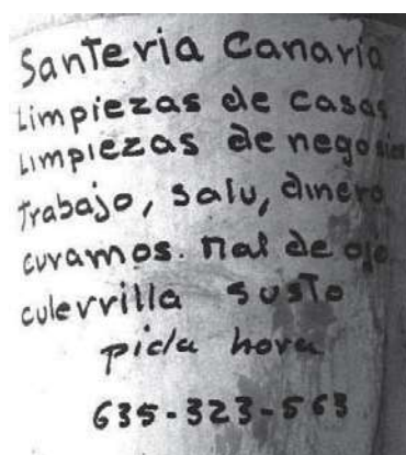
Fig..7. Cartel anunciador en calle Juana La Blanca, La Laguna, Tenerife

santiguadoras y curanderos, como la culebrilla o el mal de ojo. Los límites una vez más se cruzan y funden en la mente y la práctica.