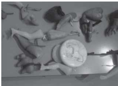
Fig.1. Exvotos antiguos expuestos en el Centro de Visitantes en Anaga, Parque Rural de Anaga, Santa Cruz, Tenerife