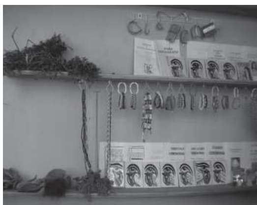
Fig..5. Local de venta de plantas de Centro Habana, La Habana, Cuba

parches o baños realizados con plantas y rezos, ya sea para curar, por ejemplo, el empacho, el susto, las verrugas y la culebrilla o para eliminar el mal de ojo, una brujería, un muerto oscuro o protegerse. Pareciera por ello que estos usos (planta-rezado) no presentan mucha diferenciación respecto a las prácticas canarias de medicina popular, y claro que existen semejanzas, pues buena parte de los métodos utilizados en Cuba tienen raíz canaria.