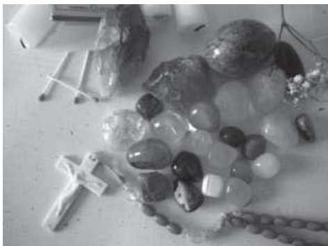
Fig.. 11. Material para despojos y limpiezas en una vivienda de Arafo, Tenerife

¿Qué suponen estas transformaciones para el ejercicio de la medicina popular y como afecta esto a su conservación? Por una parte, resulta fácil comprender como a este lado del Atlántico es complicado reproducir muchos rituales nacidos en América. Esto que traduce en la repetición de un proceso que ya tuvo lugar con la llegada de los esclavos desde África, cuando se comienza una era de innovación en el uso de las plantas, los espacios simbólicos, los animales y otros elementos. Esto no fue ni es unidireccional, sino que ocurre un proceso de apropiación de un lado y del otro. Es decir, tanto de los conocimientos y materia prima presentes en la Religión como de los usados en los rituales locales.