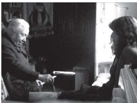
Fig..6. Sanación de la culebrilla, vivienda de una curandera en Las Mercedes, Tenerife

recen a sus hijos cuando crean que les han hecho mal de ojo, se sientan flojos, tengan dolor de estómago o simplemente antes de salir de casa. Lo que ocurre es que además se han introducido otros sistemas de protección y sanación que cada día se imponen a una población acostumbrada a las pócimas, rezados y bebedizos.