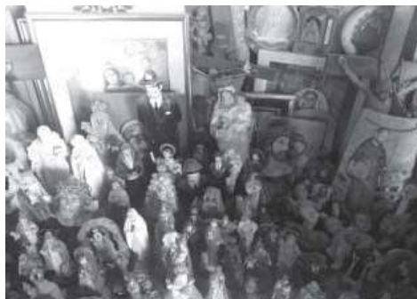
Fig.2. Exvotos al Santo Hermano Pedro, Cueva del Hermano Pedro, Granadilla, Tenerife

Todo un mundo físico, simbólico y mágico-religioso que históricamente ha sido calificado o relacionado con la brujería y hechicería. No podemos olvidar que la figura del curandero/a, la santiguador/a, la sanador/a, rezadores, adivinos/as y a veces incluso las parteras, han estado íntimamente ligados al mundo de la brujería, llegando a ser consideradas por los mismos que solicitan sus servicios de brujos y brujas a los que temer, respetar, pero en todo caso necesitar (Pérez Amores, 2018). En el siglo XXI, lejos de desaparecer, estas figuras han tomado itinerarios que los llevan de la mano de algunas de religiones traídas por inmigrantes, retornados, turistas y viajeros de la era de la globalización, cuyos itinerarios se entrecruzan en la búsqueda de soluciones a los males de este siglo.