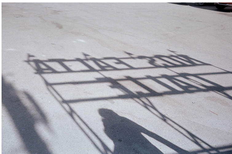
Fig. 10. La sombra del lema Nos Falta Calle proyectada en el suelo de Los Asperones, Málaga, 2021.

propósitos valientes y un serio compromiso ético con las personas que habitan los distintos territorios, así como una cada vez más importante capacidad de empatizar con otras problemáticas de carácter social.