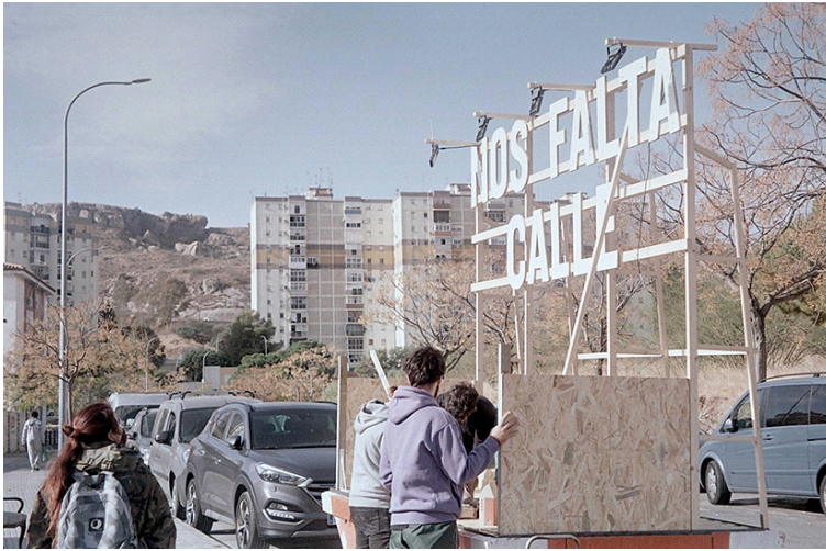
Fig. 8. Instalación del dispositivo Nos Falta Calle en Palma-Palmilla, Málaga, 2021.

situación que ha sufrido el barrio desde su creación, las relaciones originarias propias de la cultura gitana han ido deteriorándose durante más de tres décadas hasta un presente desesperado en el que cada individuo o familia tiene que lidiar en solitario para mantenerse a flote. En este contexto, resulta primordial retomar la conciencia comunitaria para poder reclamar sus derechos como colectivo y diseñar iniciativas que atiendan e involucren a toda la población. Desde Artefacto Social intentamos, aunque solo fuese temporalmente, ser parte de esa colectividad y participar junto a los vecinos, con los que pudimos aprender continuamente: «La conversación y el entendimiento es fundamental al tratar problemas sociales, ver desde otras perspectivas y tratar de solventar problemas de primera mano, codo con codo» 21 . Pudimos comprender que la participación tiene muchas expresiones, desde la conversación espontánea en la que se comparten las inquietudes familiares hasta la invitación a entender el mundo personal desde la intimidad de sus humildes casas.