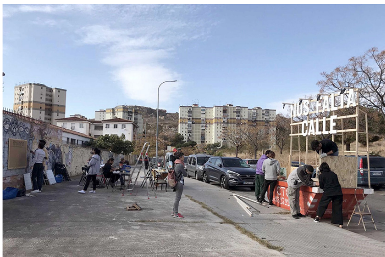
Fig. 4. Artefacto Social instalando el dispositivo para su intervención en Palma-Palmilla, Málaga, 2021.

panorama. A partir de este exigente marco de pensamiento, se establecieron varios objetivos principales, entre los que podemos destacar el trabajo cooperativo enfocado a la creación grupal en el contexto de las artes plásticas y, en otra dimensión, el enfoque de la obra hacia un impacto social. Asimismo, resultaba primordial que el proceso creativo cooperativo se desarrollara desde el entendimiento de las necesidades que lo generaban, pasando por la gestación de la idea, hasta su ejecución final. Para ello, se parte de una concepción de la práctica artística colectiva como estrategia de acercamiento y relación con las diferentes comunidades, permitiendo que el estudiantado comprenda tanto las necesidades como las prioridades de los grupos de personas para los que proyecta su trabajo.