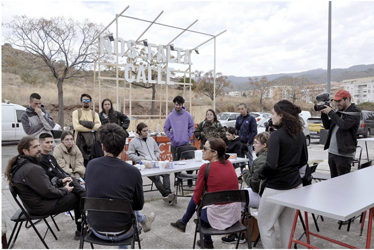
Fig. 3. Asamblea de Artefacto Social en plena calle. Palma-Palmilla, Málaga, 2021.

una aceleración perpetua. Puesto que si no nos movemos con la suficiente rapidez y no nos detenemos a mirar atrás para hacer un recuento de las ganancias y las pérdidas, podemos seguir apiñando aún más vidas en el espacio temporal de una vida mortal 6 . Una aspiración a la eternidad, al supuesto poder de cambiarlo todo, que nos somete a marcar continuamente la diferencia 7 .