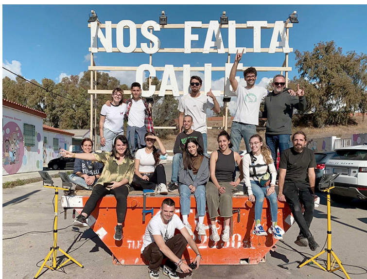
Fig. 9. Intervención de Artefacto Social en Los Asperones, Málaga, 2021.

y conflicto, a no dejar de hacer preguntas. Todo ello con la voluntad de tener una incidencia social y combatir el neoliberalismo despiadado que reina en nuestra civilización. Estamos de acuerdo en que en este contexto de individualismo y competitividad regido por lo virtual, los requisitos para el cambio serían demasiados: