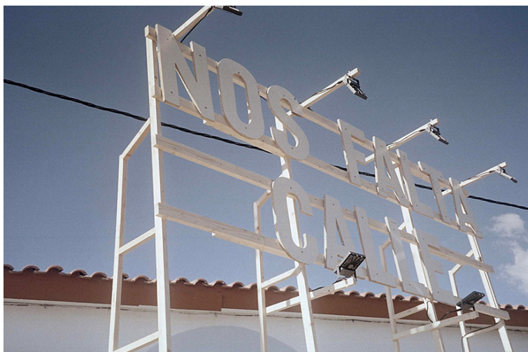
Fig. 7. Letrero NOS FALTA CALLE instalado en Los Asperones, Málaga, 2021.

proyecto Nos Falta Calle . La cuba se convertiría así en espacio de reunión, entendimiento y reclamación para el barrio de Los Asperones; en cocina donde preparar un desayuno solidario y servir de encuentro para la diversidad cultural de Palma-Palmilla; o en escenario musical en El Palo, donde se quiso manifestar esa peculiar mezcla de lo autóctono y la modernidad marcada por la expansión urbanística y el turismo. Todo el proyecto sería recogido mediante una documentación fotográfica y audiovisual para su posterior difusión. En paralelo se llevarían a cabo numerosas actividades con ese enfoque antropológico a la vez que poético: desde conversaciones con los vecinos y entrevistas con personas representativas de cada comunidad, hasta la recogida de objetos encontrados. En todo caso, la cuba con el letrero sirvió como motor de relaciones y generador de mitos.