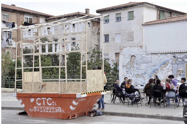
Fig. 1. Dispositivo creado por el equipo de Artefacto Social en Palma-Palmilla, Málaga, 2021.