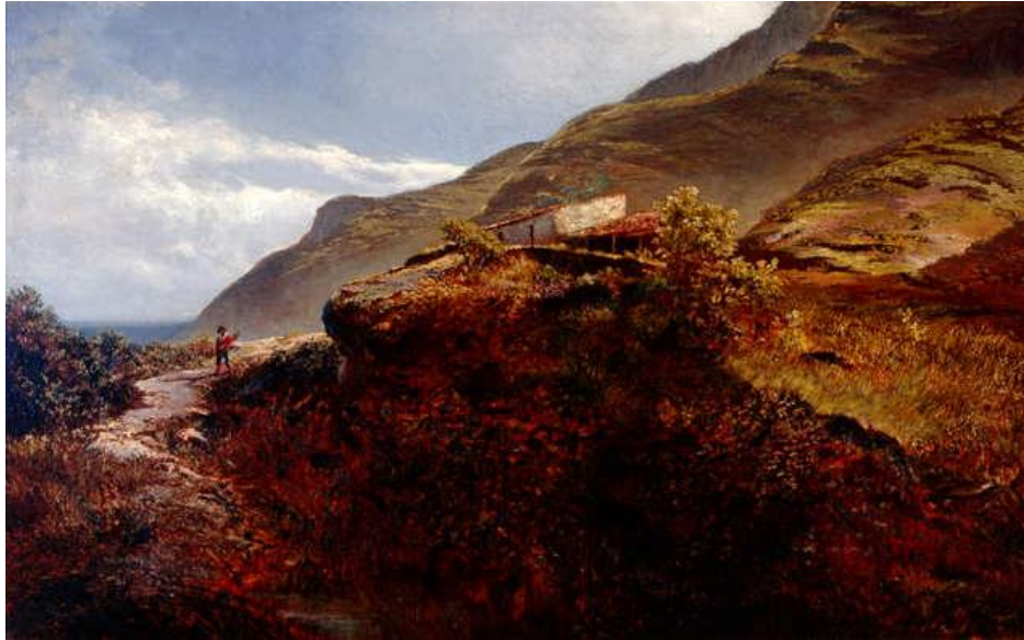
“Paisaje de Punta del Hidalgo”, Valentín Sanz. Óleo sobre lienzo. Colección particular (Hernández, 2008, 283)