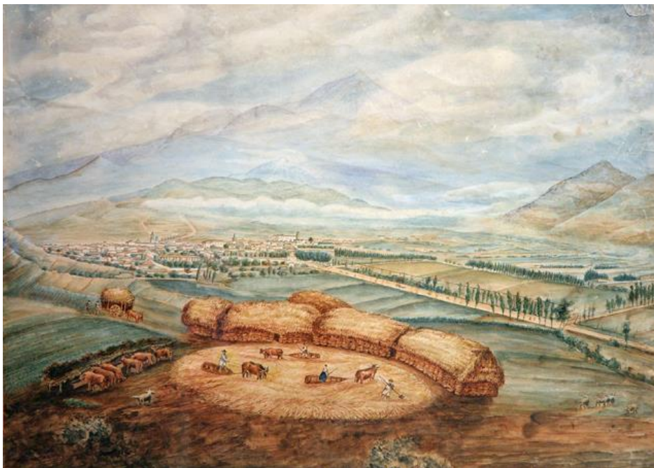
Vista de la vega lagunera hacia mediados del XIX, por Alejandro de Ossuna y Saviñón (Díaz, 2009, 318)