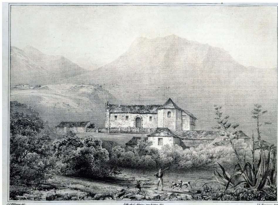
Ermita de Gracia y casona de los Estévez, representadas por J. J. Williams en la primera mitad del siglo XIX (Berthelot, 1997)