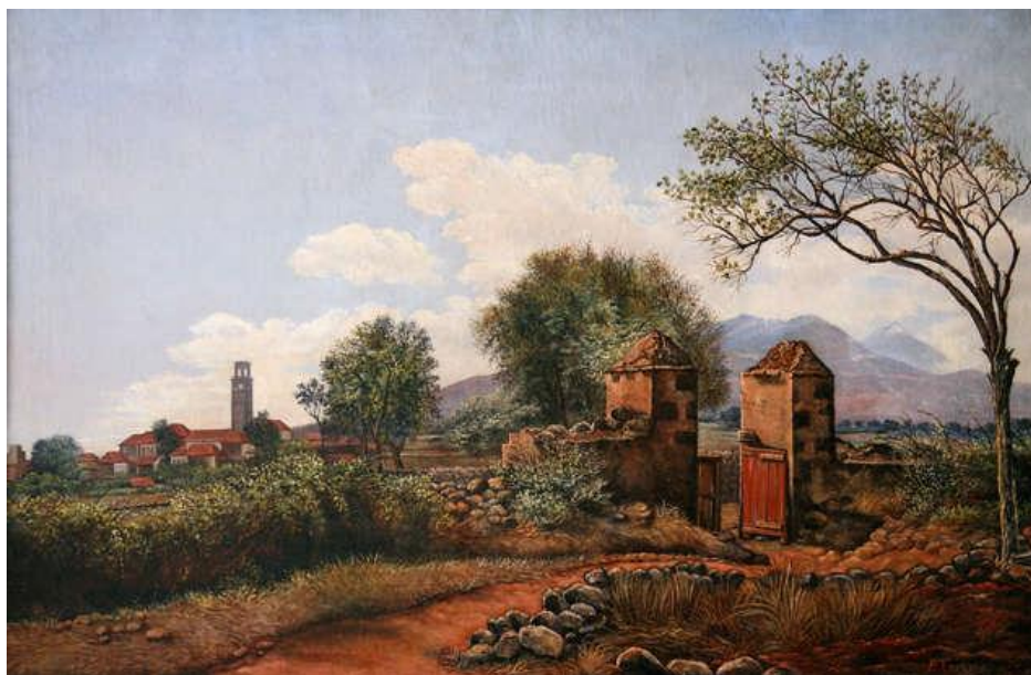
“Portada de una finca con La Laguna al fondo”, Pedro Tarquis. Óleo sobre lienzo. Colección particular (Hernández, 2008, 282)