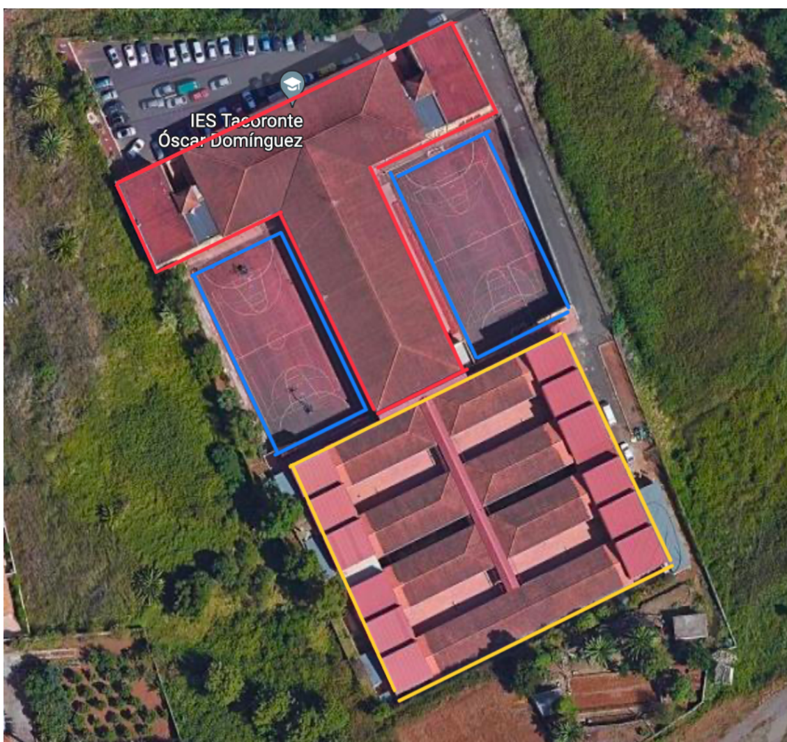
Ilustración 1 - Edificación IES Tacoronte Óscar Domínguez

El IES Tacoronte – Óscar Domínguez se construyó a principios de la década de los 80, una edificación acorde a la arquitectura de la época. La estructura principal del centro educativo es una obra en forma de “ T ” invertida (señalado en color rojo, zona 1), en su parte trasera con forma cuadrada se encuentra otro edificio que alberga otros espacios del instituto (señalado en color amarillo, zona 2), y finalmente, a los lados de la “ T ” se encuentran dos canchas (señaladas en color azul, zona 3). Dichas zonas mencionadas, se muestran en la ilustración 1.