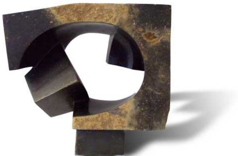
Onda Partícula. Basalto. 40 x 43 x 20 cm.