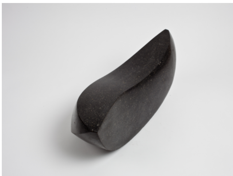
Contingencia02. Baslto negro, 33x53x10 cm. 2012.