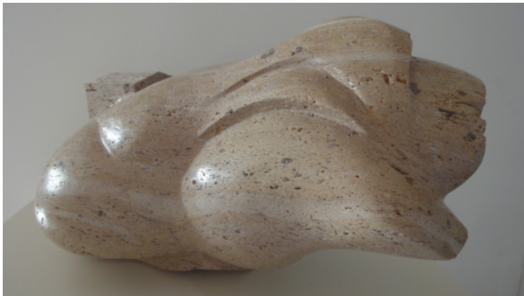
Nube . Piedra de Agüimes, Gran Canaria. 40 x 40 x 40cm. 2011.