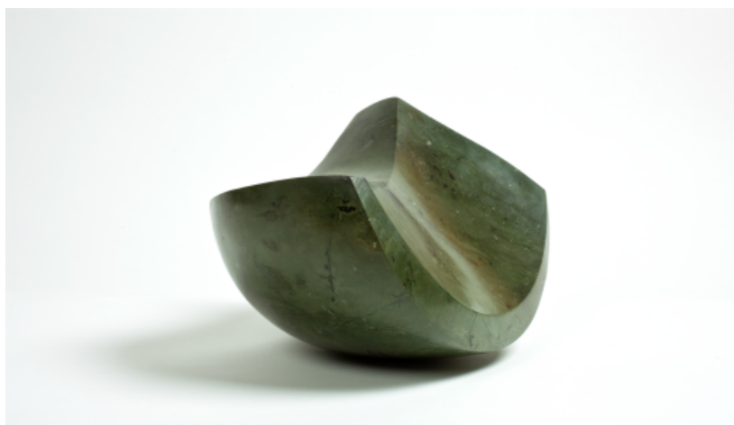
Contingencia01. Basalto verde, 25x14x17,5 cm, 2011.