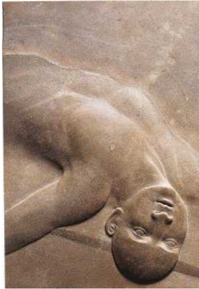
Bajorrelieve. Piedra de Tindaya. 60 x 40 cm. 2000.