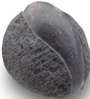
Afrodita. Basalto y resina. 50 x 37 x 37 cm. 2011.