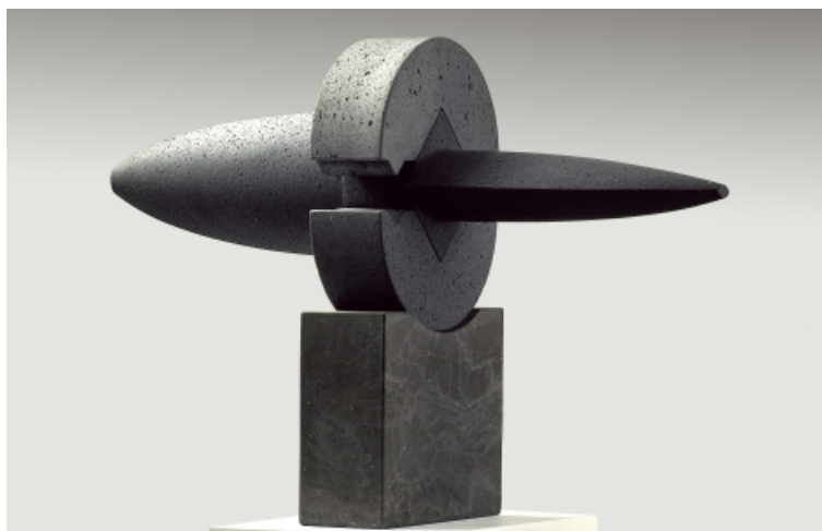
Las tenazas. 80x110x40 cm.