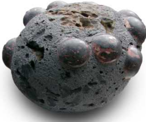
Ciego. Basalto y resina. 45 x 40 x 30 cm. 2009.