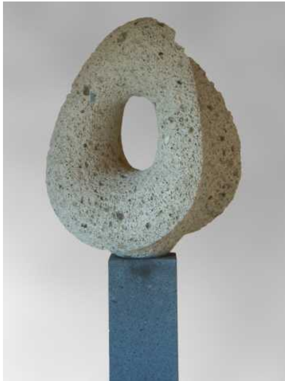
Sin título. 160 x 38 x 34 cm. Tosca, Tenerife. 2012.