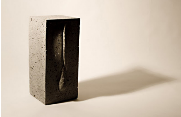
Piedra blanda 1. Basalto. 29.5 x 15,5 x 13,5 cm. 2009.