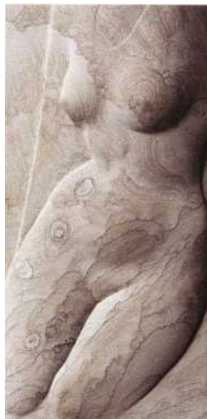
Bajorrelieve. Piedra de Tindaya. 60 x 30 cm. 2001.