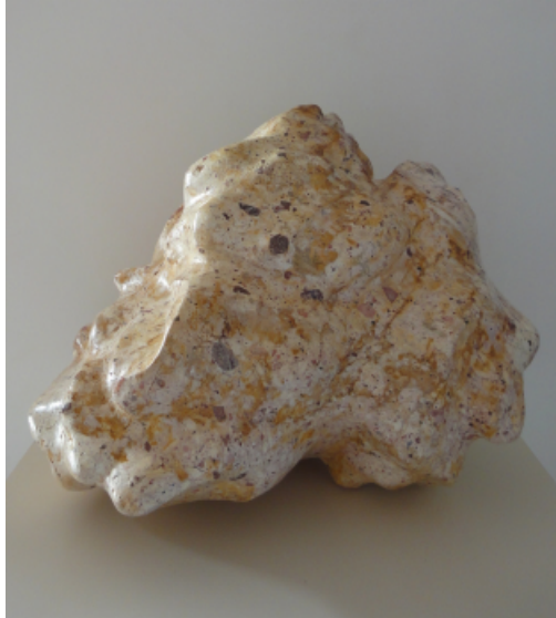
Nube viajera. Piedra de Agüimes, Gran Canaria. 45 x 35 x 30cm. 2011.