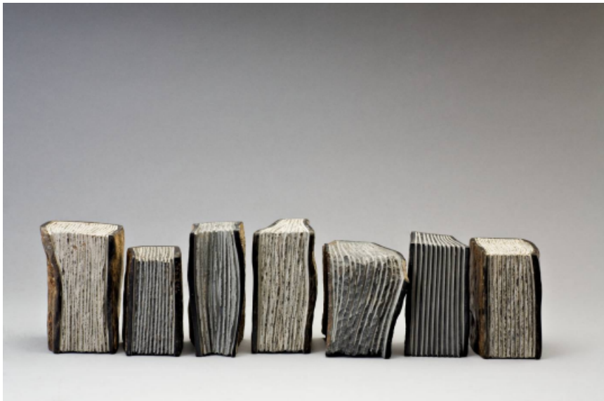
Libros. Prismas de Basalto. Medidas variables. 2006.