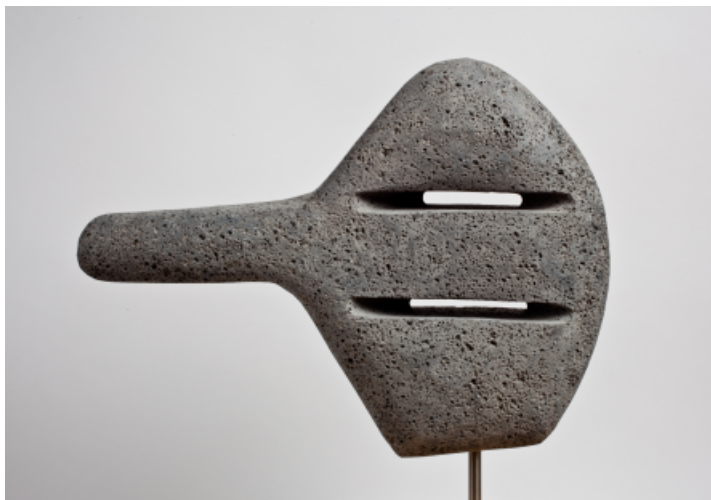
Serie ideograma. Piedra molinera. 38,5x52 cm. 2011.