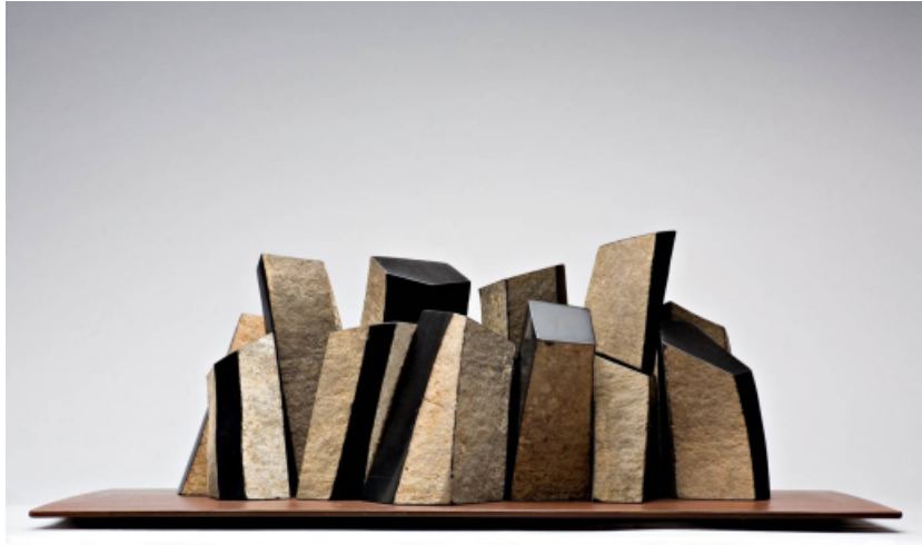
Construcción XII. Prismas de basalto. 26 x 70 x 40 cm. 2006.