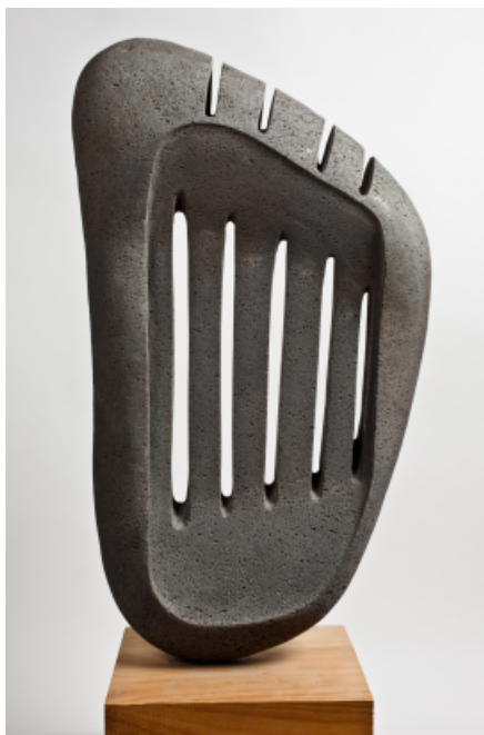
Serie podomorfos Tindaya. Piedra molinera, 78,5x47 cm. 2011.