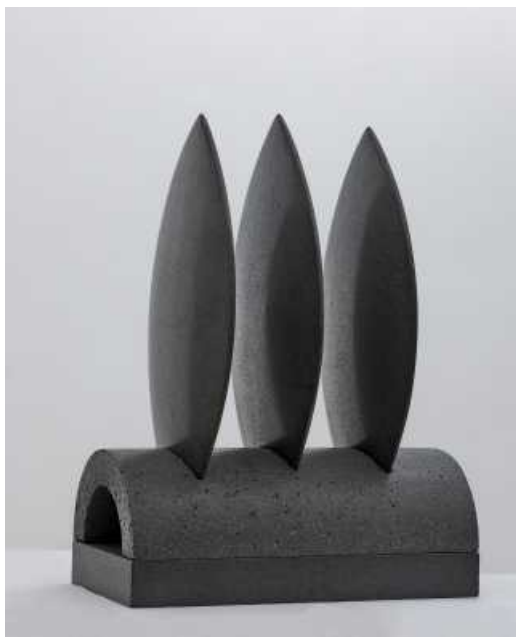
Laurisilva. 58x50x27 cm. 2012.