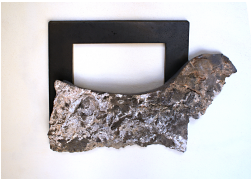
Alaire. Basalto. 44 x 62 x 11 cm. 2008.