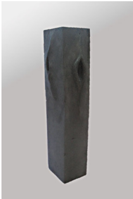
Piedra blanda 3. Basalto. 64 x 17 x 16,5 cm. 2009.