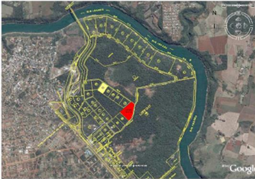
Figura 2: Mapa de ubicación de las comunidades

Aquí se puede diferenciar esta área de la zona periurbana, marcada por la ruta nacional N° 12 y dentro de esta, el loteo de los emprendimientos hoteleros turísticos, colindantes a la ruta y a la costa del Río Iguazú.