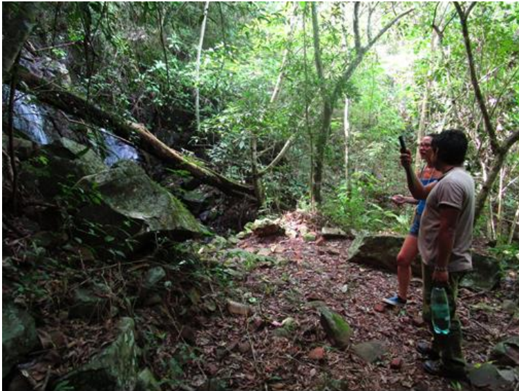
Figura 3: Recorrido turístico dentro de las comunidades