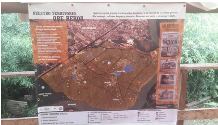
Figura 4: Mapa Nuestro Territorio - Ore Rekoa